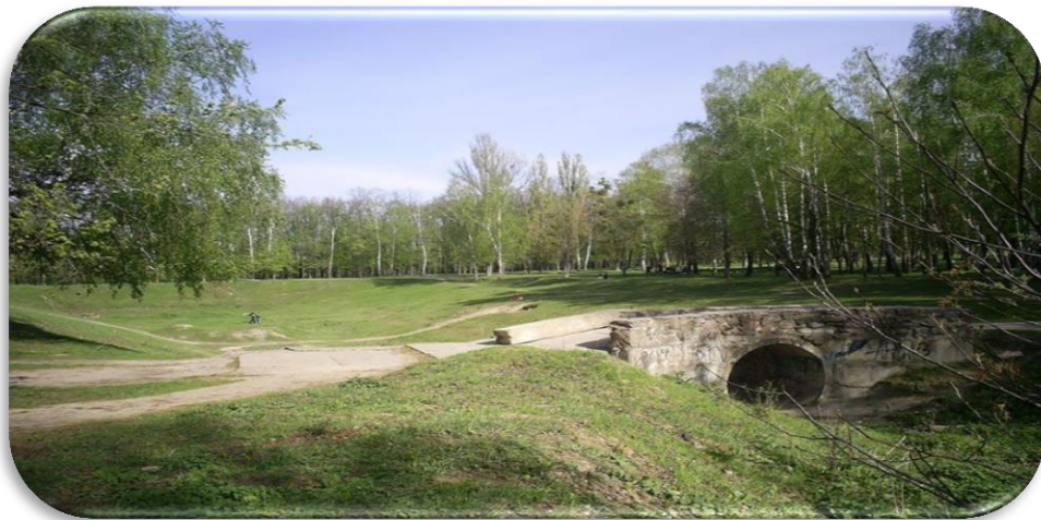
Сучасний вигляд Графського ставу у парку ім. Тараса Шевченка

Водоносний горизонт є джерелом централізованого водопостачання м. Боярка.