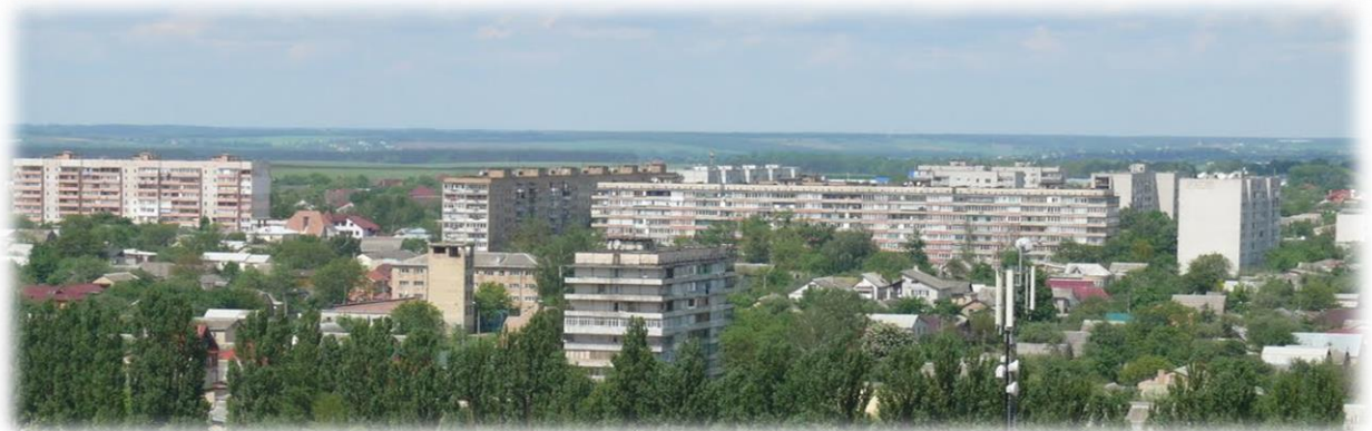
Сучасні панорамні зображення Боярки

Планувальна структура міста об'єднує існуючі функціональні зони в вигляді двох планувальних утворень – Історична Боярка та Нова Боярка, які розрізані залізницею. Відсутність шляхопроводів через залізницю є основною проблемою на шляху створення єдиної планувальної структури міста.