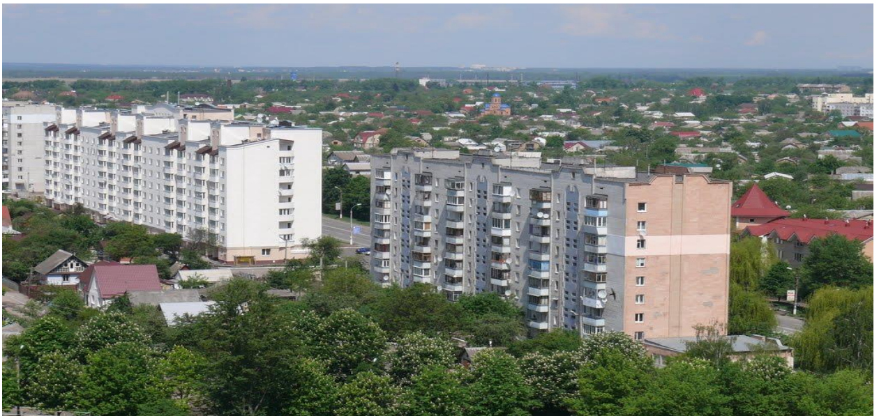
Вигляд на будівлі однієї із центральних вулиць Боярки - вул. Білогородська

Міграційний баланс населення на початку XXI століття був від'ємним. Однак, в останні роки міграційний баланс є додатнім. Розташування м. Боярки в зоні впливу Києва обумовлює міграційний приток населення.