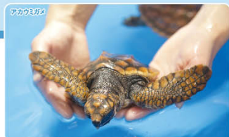
鴨川市東条海岸は、アカウミガメの産卵場所です。写真は、この浜で産んだ卵を保護し、園内の「海亀の浜」でふ化した生後6ヶ月のアカウミガメです。