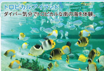
トロピカルアイランド ダイバー気分、トロピカルな南の海を体験。