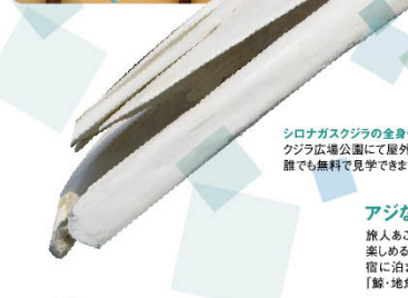
シロナガスクジラの全身骨格標本 クジラ広場公園にて屋外展示しているので、誰でも無料で見学できます。