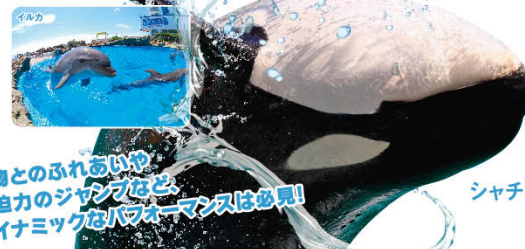
動物とのふれあいや、大自力のシャチなど、ダイナミックなパフォーマンスは必見!