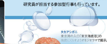
タカアシガニ 東京湾の入口「東京海底谷」の海前にくらよすオゾラマで展示。