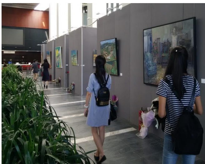
图二：人民大学图书馆

通过这次参观学习，让我意识到空间服务功能在未来或许成为图书馆的核心功能和亮点。北京大学的国际学生学者中心分馆让人记忆深刻。这个分馆藏书量仅有 2000 余册，作为一个“没有图书的图书馆”，它的功能作用主要在空间服务。目前主要接待北京大学的留学生。这个图书馆的布局融合了中西文化，整个空间设计追求时尚、现代、个性，营造了会议室、讨论室、卡座、贵宾厅等多个个性化的布局空间，整个空间的桌椅都是可移动，可随意组合。研讨室的空间大小可进行合并或拆分。人民大学图书馆在空间服务方面也颇有所成，一进图书馆迎面而来的文化氛围浓厚的绘画艺术长廊，让读者禁不住驻足鉴赏。它还推出了精品视听室，读者可以免费预约在一个较为私密的空间欣赏影音视频。