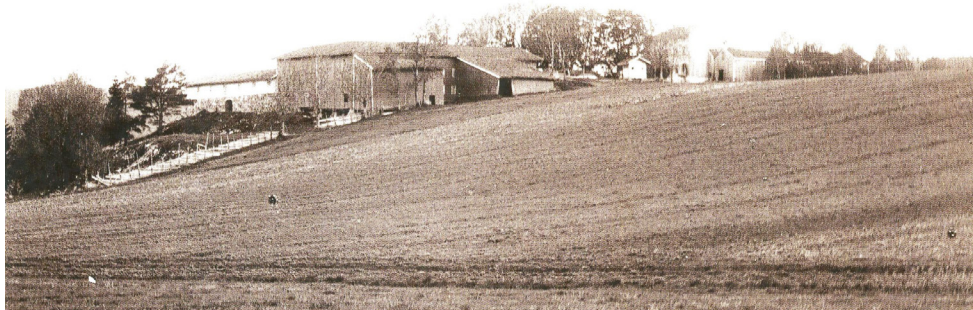
Åkerlandskap på Abildsø

Til tross for god søkning var målet å få opprettet friplasser til verdig trengende. Subsidiert til å holde skolepengene nede på et for bøndene anstendig nivå, ble blant annet oppnådd ved at