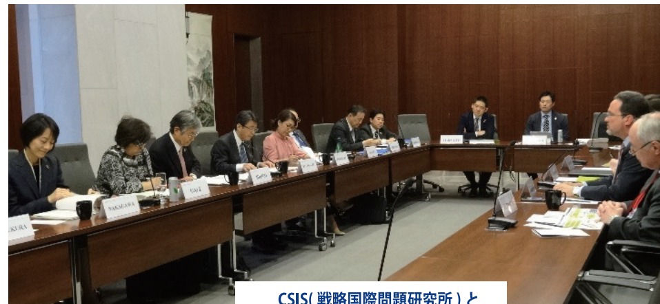
CSIS(戦略国際問題研究所)と