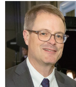
CII (米国機関投資家評議会) バーシュ エグゼクティブ・ ディレクター