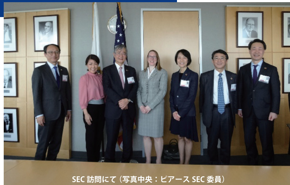
SEC 訪問にて (写真中央：ピアース SEC 委員)