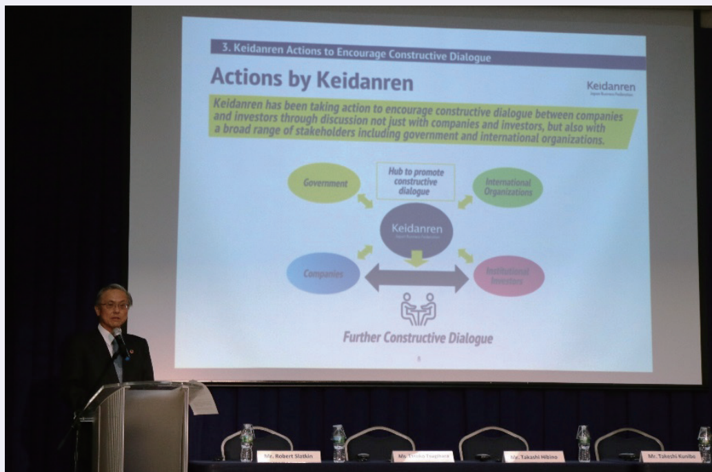
経団連の取り組みについて説明する國部副会長