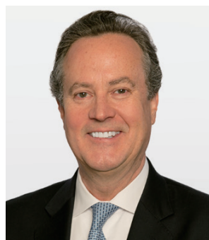
S&P Global ピーターソン社長・ CEO