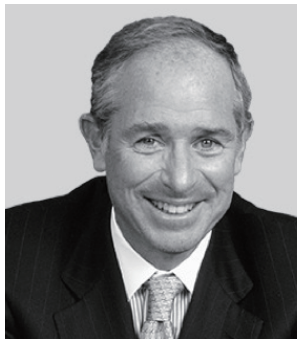
Blackstone シュワルツマン 会長・CEO