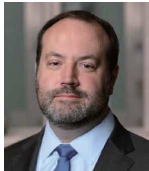
TIAA (全米教職員年金保険組合)