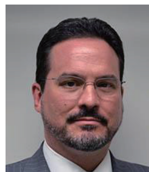
CSIS グリーン 上級副所長