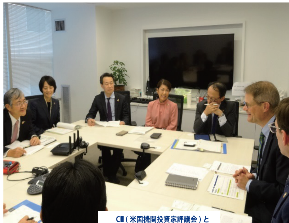
CII (米国機関投資家評議会) と