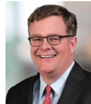
Neuberger Berman ウォーカー 会長・CEO