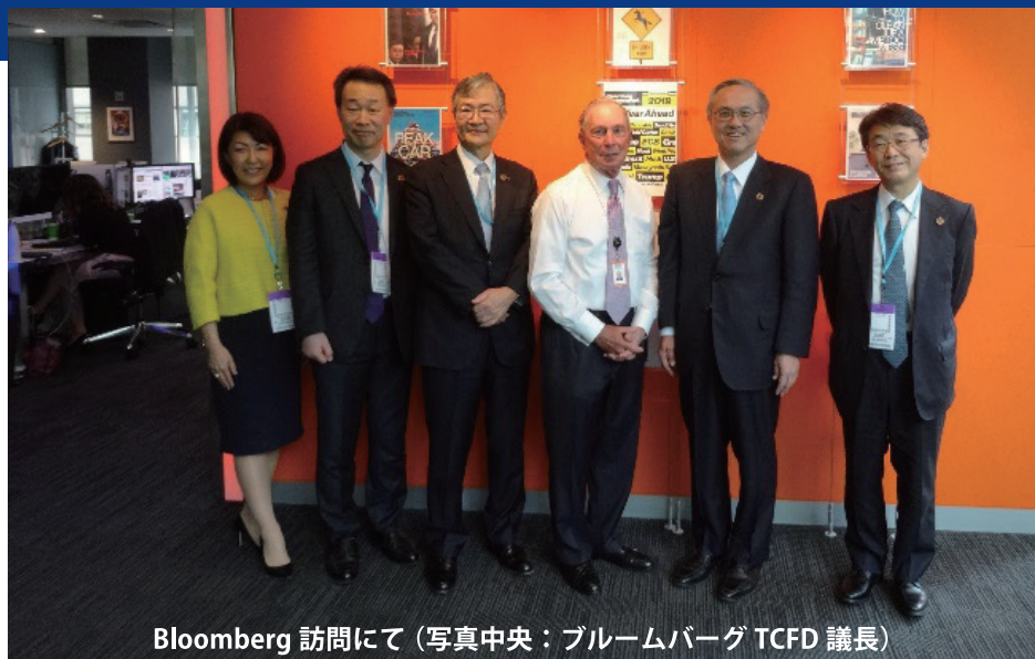
Bloomberg 訪問にて (写真中央：ブルームバーグ TCFD 議長)