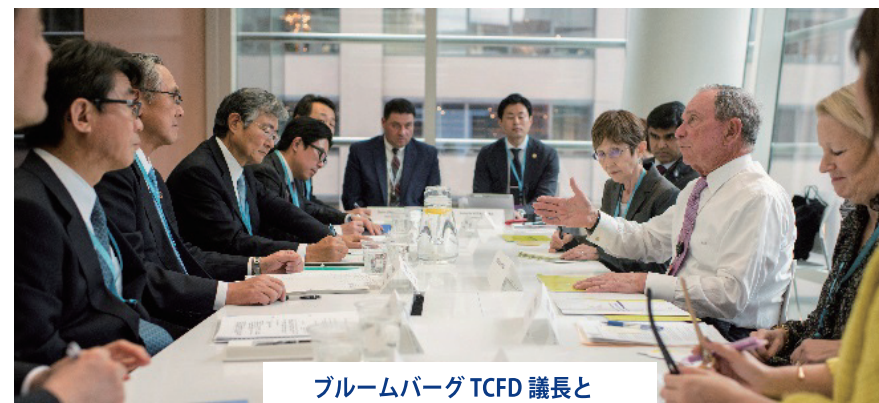
ブルームバーグ TCFD 議長と