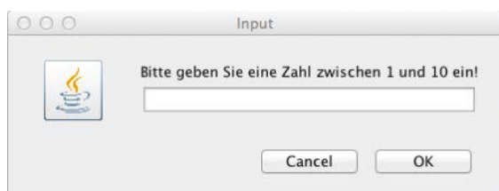
Eingabe der zu erratenden Zahl

Eine mögliche Ausgabe könnte wie folgt aussehen: