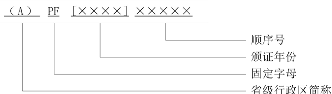
图A.1 烟花爆竹经营（批发）许可证编号编码结构

烟花爆竹经营（批发）许可证的证照编号由“省级行政区简称”+“PF”+“颁证年份”+“顺序号”组成，如图A.1所示：