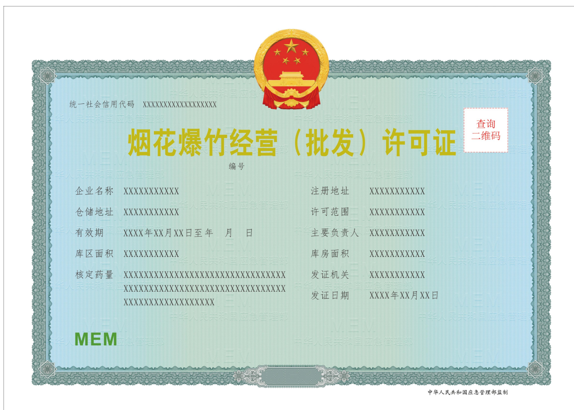
图 2 烟花爆竹经营（批发）许可证

烟花爆竹经营（批发）许可证电子证照照面包含“国徽”（符合GB 15093—2008要求）“烟花爆竹经营（批发）许可证”“编号”“统一社会信用代码”“企业名称”“注册地址”“仓储地址”“许可范围”“有效期”“至”“主要负责人”“库区面积”“库房面积”“核定药量”“发证机关”“发证日期”“年 月 日”和“中华人民共和国应急管理部监制”等。