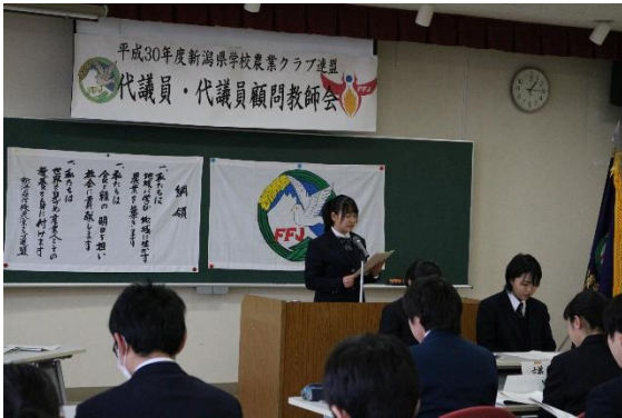
新潟県連盟 夏季大会・総会