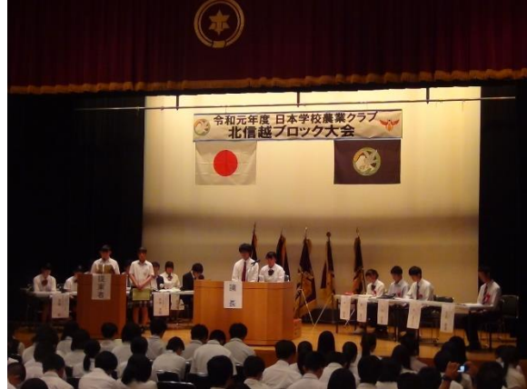
北信越ブロック大会※1