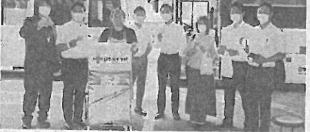
この日献血に集まった同会議所会員

IPトランシーバー無償貸出 アイコム(KDDI) アイコム(大阪市平野 区、播磨正隆社長)とK DDI(東京都千代田区、 高橋誠社長)は、新型コ ロナウイルス感染症拡大 防止と経済活動の両立を 目的に、11日から12月31 日まで、医療機関や自治