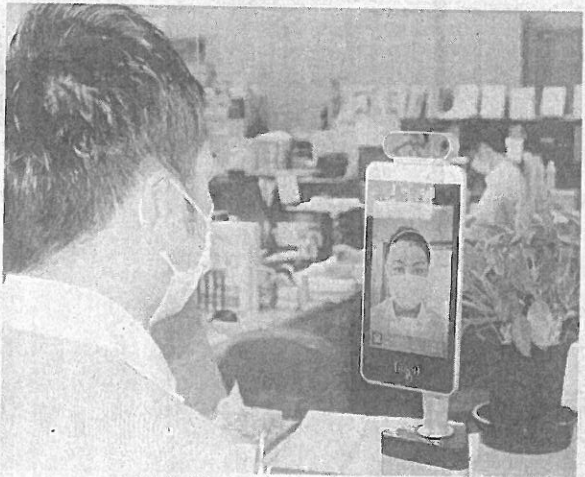
マスクを着用したままでも検温が可能