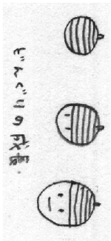
ヒンベリーの成長