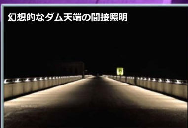
幻想的なダム天端の間接照明