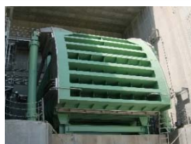
国内最大の引っぱり式のラジアルゲートを採用