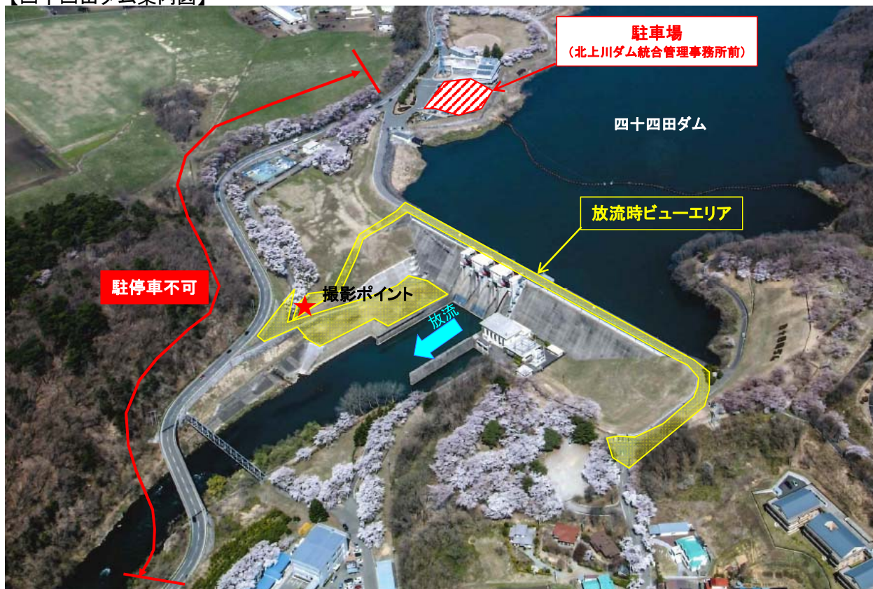
【四十四田ダム案内図】