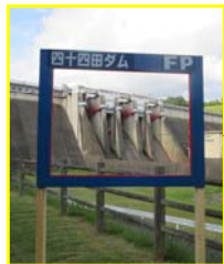
ダムカード風 フレームもあります