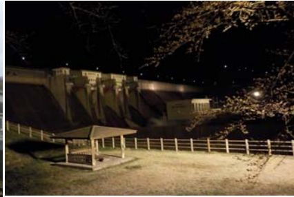
四十四田ダム 夜間ライトアップ