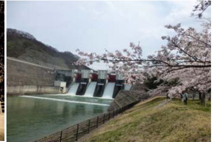
御所ダム クレストゲートからの点検放流

※湯田ダム(西和賀町)では4月21日22日に点検放流を行います。詳しくは下記をご覧ください。