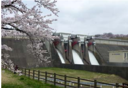
四十四田ダム クレストゲートからの点検放流