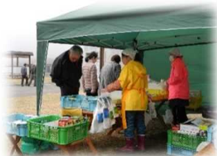
地元特産品などの販売