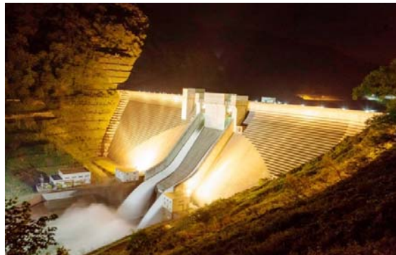
【展望広場から見たライトアップと自然放流】