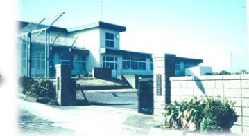
写真② 平成3年撮影(旧校舎)