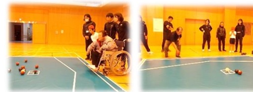
写真 ボッチャ協議会の様子