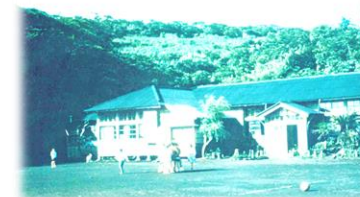
写真① 昭和38年頃撮影(旧校舎)

例えば、昔の校舎は、どのような様子だったのでしょうか。写真①は、昭和38年頃に撮影された校舎の様子です。木造校舎の後ろには、山が見え木々が広がっています。また、写真②は、平成3年に撮影された旧校舎と正門の様子です。正門の学校名の文字が刻まれた石板は、現在も、本校校務センターのガラスケースに大切に保管されています。そして、写真③は現在の様子です。