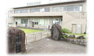
写真③ 令和5年撮影(現校舎)

また、本校の伝統、文集「ぐろしお」は、いつ頃から始まったのでしょうか。下の写真④は、文集「ぐろしお」の表紙です。現在、学校で保管されている最も古いものは、昭和28年(1953年)に発行された「黒ぐろしお潮」第4号でした。紙の色が変色していますが、当時の作文もしっかり読むことができる状態です。ぜひ、児童・生徒、保護者の皆様、地域の皆様に、実物を手に取ってご覧いただくことができるように、「(仮称)ぐろしおフェス150プロジェクト」の計画・準備を進めてまいります。本校教職員一同、保護者・地域の皆様と一緒に、開校150周年記念式典を盛り上げていきたいと思ひます。ご理解とご支援賜りますよう、お願ひ申し上げます。