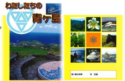
写真:「わたしたちの青ヶ島」表紙・裏表紙

これまで地域の皆様が大切にしてきた思いや願いを大切に、青ヶ島の自然・歴史・伝統・文化・暮らしなどについて、児童・生徒の学習活動を通して、地域の皆様にインタビューや撮影などの取材をお願いすることもあるかと思っております。ご理解とご支援賜りますよう、よろしくお願い致します。