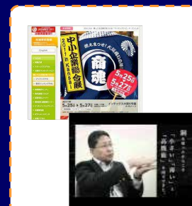
ホームページ、映像制作