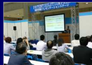
展示会受託／展示ブース運営

数々の主催展で培ったノウハウを基に、官公庁や自治体から受託した展示会の運営や子ども向けイベントを実施しております。また、セミナーの受託運営も行っており、ご要望を頂ければ、講師の派遣もいたします。