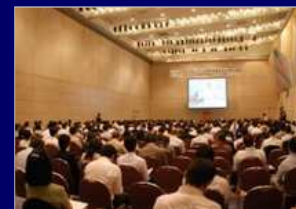
受託セミナー運営