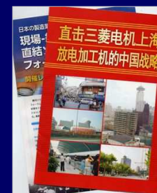
カタログ制作（紙、電子ブック）

貴社PRに必要な各種コンテンツの企画、構成、制作等を承ります。貴社の歴史や技術を一冊の本にまとめます。日ごろお使いいただく会社紹介等のカタログ、ホームページや動画等のコンテンツ制作、海外向けの翻訳サービス等をご提案します。