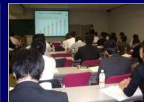
広報関連（講師アレンジ等）