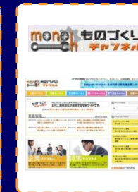
ものづくりチャンネル