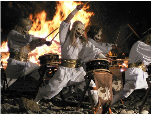
白面金毛九尾太鼓 (御神火祭)