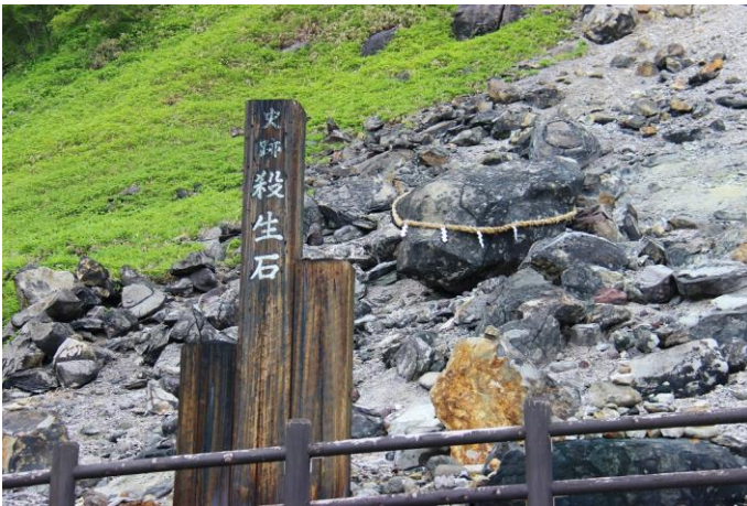
割れる前の殺生石 (2014. 6. 27 撮影)