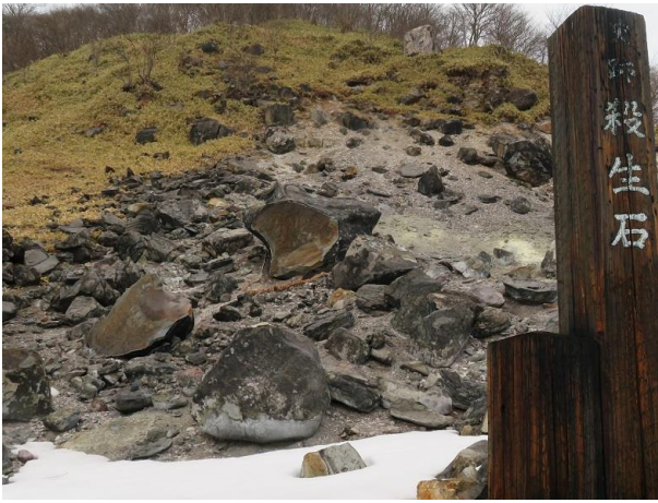
割れた殺生石 (2022. 3. 5 撮影)