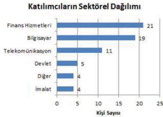
Şekil 2. Katılımcıların sektörel dağılımları

Katılımcıların görev aldıkları organizasyonların yer aldığı sektörlerin çoğunu Şekil 1’de görüldüğü üzere, sırasıyla finans-bankacılık, bilişim ve telekomünikasyon oluşturmaktadır. 4 katılımcıdan oluşan diğer başlığı altında yayıncılık, internet/e-ticaret, eğitim, otomotiv ve havacılık sektörleri vardır. Katılımcıların geniş bir sektörel çeşitliliğe sahip olduğu söylenebilir.