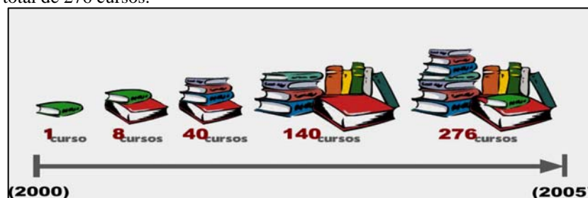
Figura 1. Evolución de los cursos desarrollados.

La UPA se ha consolidado como un servicio cada vez más utilizado por la comunidad docente de la Universidad Politécnica de Valencia. Desde 2000 se han impartido un total de 276 cursos.