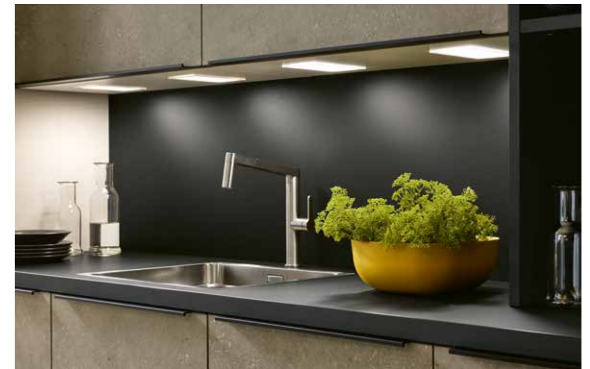
proline 128 VA Terrazzo Sorano Terrazzo Sorano Terrazzo Sorano

DOELMATIG VORMGEGEVEN SUPERBE AMENAGEMENT