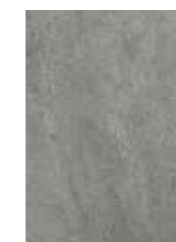
Keramik Grigia Keramiek Grigia Céramique Grigia