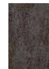
Keramik Oxide Nero Keramiek Oxide Nero Céramique Oxide Nero