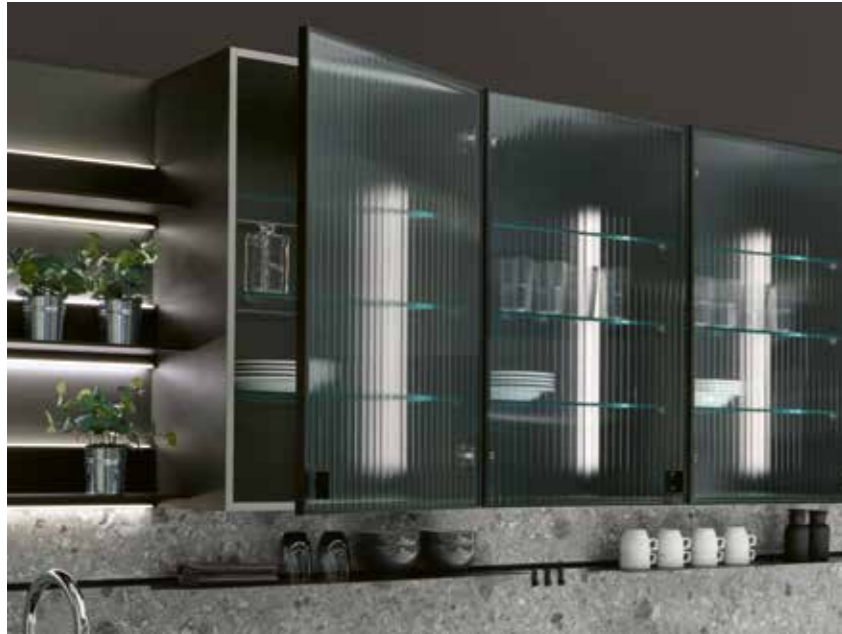
HARMONIE IN SAMENSPEL JEU HARMONIEUX