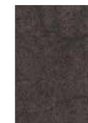
Keramik Antracite Keramiek Antracite Céramique anthracite