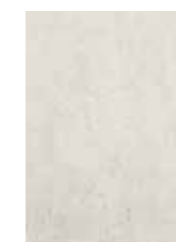
Keramik Perla Keramiek Perla Céramique Perla

MATERIAAL VOOR DE ZINTUIGEN UN MATERIAU SENSUEL