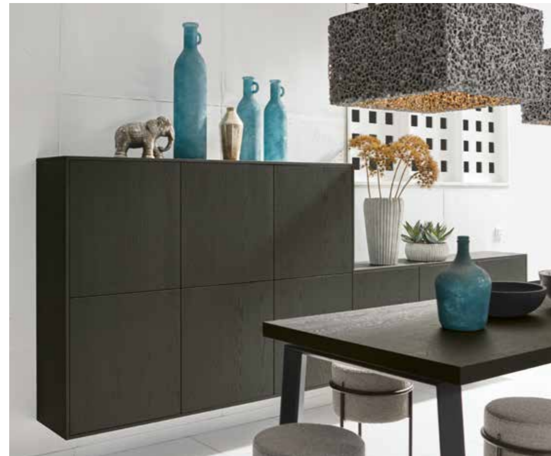
proline 128 EV Eiche basaltgrau gebürstet eiken basaltgrijs geborsteld chêne gris basalte brossé

Raffiniert: Die Beleuchtung in den Oberschränken illuminiert geschickt die vertikale Lamellenstruktur und bringt die Glasböden im Schrankinnern zum Strahlen. Der frei schwebende Solitärschrank in basaltgrauer Eiche setzt einen betont wohnlichen Akzent.