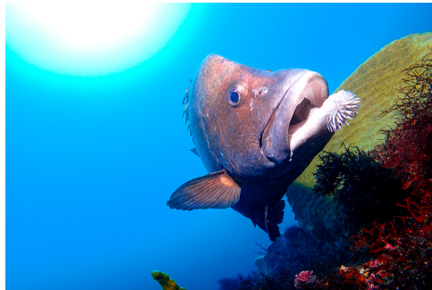
西川名へようこそ