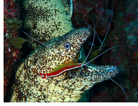
毎日歯磨きしてるー?