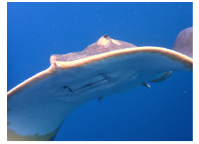
笑って 飛んで エイ!