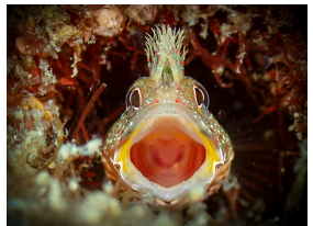
こんにちわあああ〜!