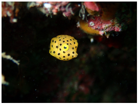
あなたにフォーリンラブ