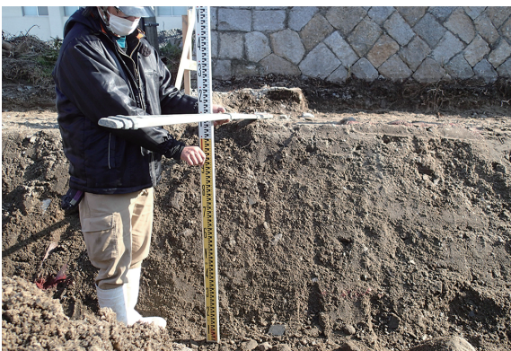
写真 45 B地点土層断面 (北西から)