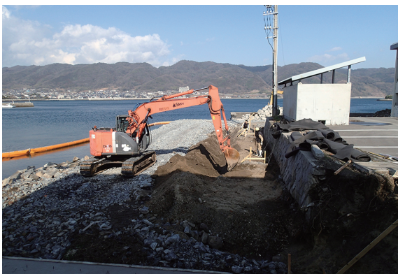
写真 44 調査区東部掘削状況 (南西から)