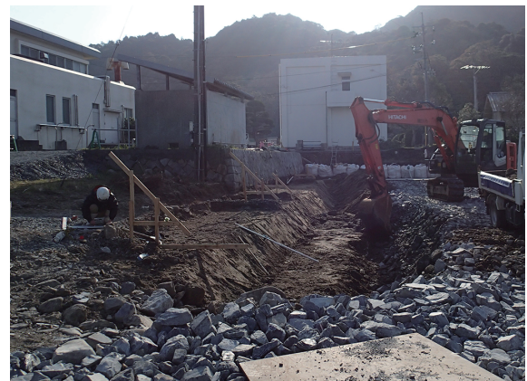
写真42 調査区全景(北東から)