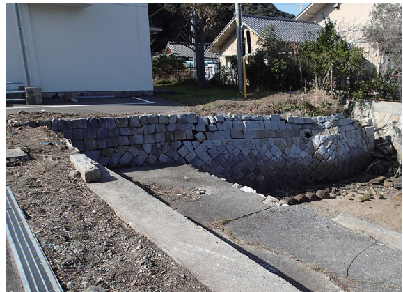
写真41 調査区西部調査前状況(東から)