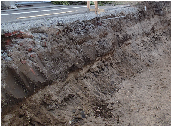
写真 43 調査区西部土層断面 (東から)