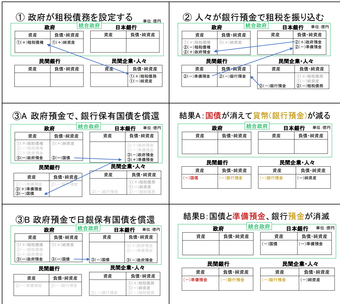
表2 課税によって国債が償還されるとおカネが消える仕組み