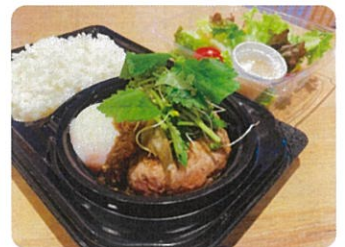
ハンバーグ (和風オニオンソース) ¥1,100