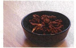
くるみのスパイス飴かけ