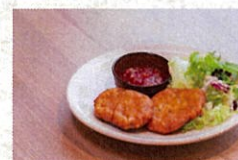
タイ風 さつまあげ - スイートチリソース -