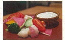
季節野菜盛り合わせ ブルーチーズソースで