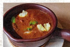
野菜のスープカレー