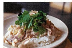
和風カオマンガイ