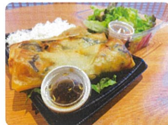
グリーンカレー ¥1,060 春巻き