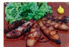
豚トロ炙りチャーシュー - 南乳だれで -