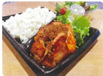
ポークジンジャー ¥1,060