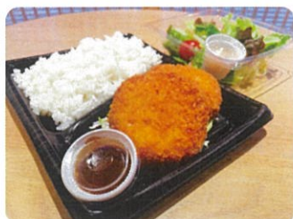
カニクリームコロッケ ¥1,140