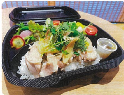
和風カオマンガイ ¥1,060 ナンプラーを使用しております