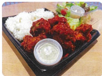
ヤンニョムチキン ¥1,060