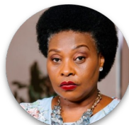
Yvonne Chaka Chaka Chanteuse et personnalité publique