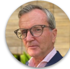
Andrew Kirkwood Directeur du Bureau de Genève Bureau des Nations Unies pour les services d'appui aux projets (UNOPS)