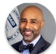
David Walton Initiative présidentielle des États-Unis contre le paludisme