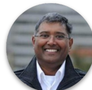
Sherwin Charles Goodbye Malaria