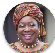
Lola Dare Chestrad Global