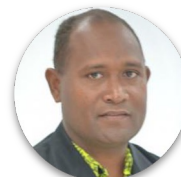
Culwick Togamana Gouvernement des Îles Salomon