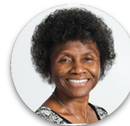
Présidente du conseil d'administration Joy Phumaphi Alliance des dirigeants africains contre le paludisme (ALMA)