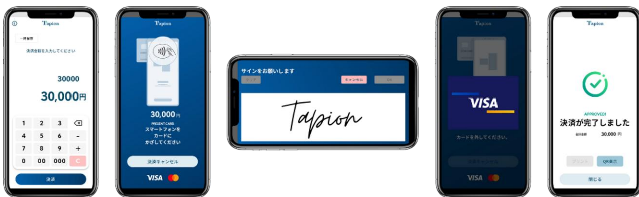
【Tapionの電子サインの操作イメージ】

従来、通常の据置型決済端末では、タッチ決済で 15,000 円を超えた場合には接触 IC、もしくは電子サインに誘導することで 15,000 円超えの決済に対応しています。市販のスマートフォンを用いる Tapion でも、電子サインに対応（本人認証実施）することで 15,000 円超のタッチ決済を実現します。