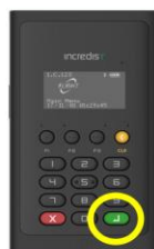
レジで暗証番号を入力せずバイパス（スキップ）する