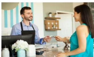
顧客がレジに移動して決済をする ⇒決済動作が増え顧客満足度に影響