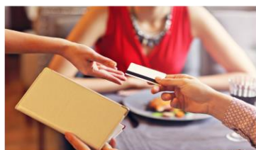
店員にカードを渡す