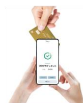
テーブル決済を継続できる ⇒顧客の利便性を維持