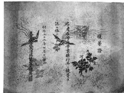
河辺正夫賞状三種