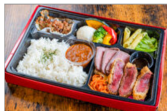
道産ビフカツとローストビーフの洋食ミートBOX