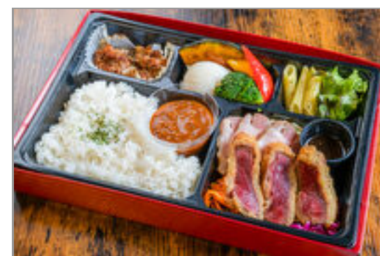
道産ビフカツと塩麹ローストポークの洋食ミートBOX