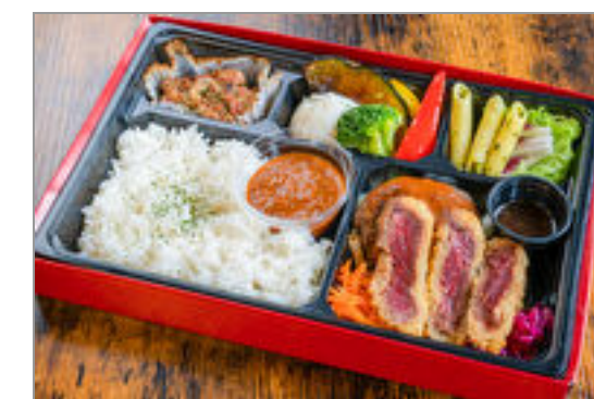
道産ビフカツとハンバーグの洋食ミートBOX