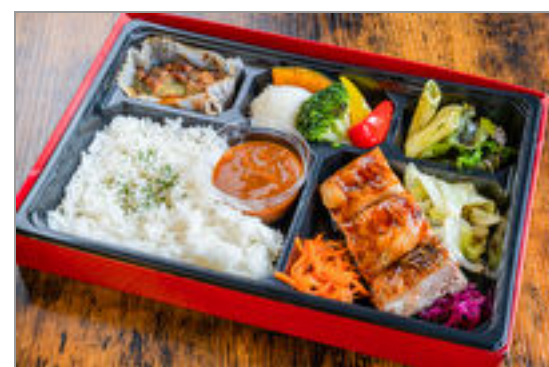
照り焼きチキンソテーの洋食ミートBOX