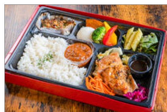
香草チキンステーキの洋食ミートBOX

商品によっては、注文条件やオプション・サービス等がございますので、詳しくはWEBでご確認ください。