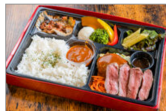
道産牛フィレステーキとハンバーグの洋食ミートBOX