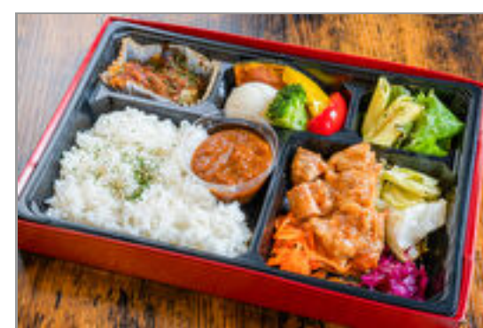
とろとろチキンのトマト煮洋食ミートBOX