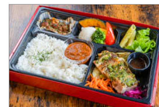
バジルチキンソテーの洋食ミートBOX