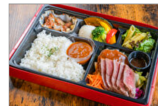
道産牛サーロインとハンバーグの洋食ミートBOX