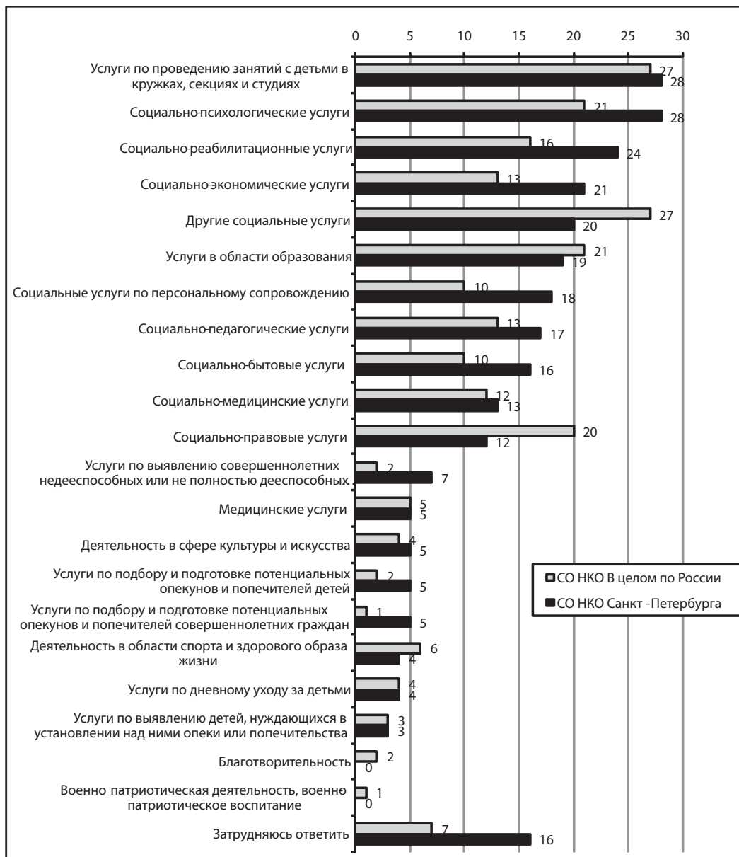
Рис. 1. Распределение ответов на вопрос «Какие виды социальных услуг оказывает Ваша организация?» (% от опрошенных, N = 108)

своего рабочего времени могут лишь те НКО, кто ориентирован на предельно широкий круг своих потребителей, включая самые разные социальные группы. Большинство СО НКО сегодня вынуждены затрачивать рабочее время на решение иных проблем, стоящих перед их организацией. Это подтверждает и то, что большинство петербургских СО НКО (66%) сталкиваются с определенными трудностями при работе с получателями поддержки или потребителями услуг. На отсутствие таких трудностей указали 44% СО НКО Санкт-Петербурга. И этот показатель практически полностью совпадает с общероссийскими данными. Но если для большинства российских СО НКО это в первую очередь трудности, связанные с отсутствием постоянного помещения (27%), низким уровнем активности граждан (19%), недостатком информационных материалов, необходимых для работы (13%), то для СО НКО Санкт-Петербурга главная проблема — активность населения (27%). Имущественные проблемы, проблемы с