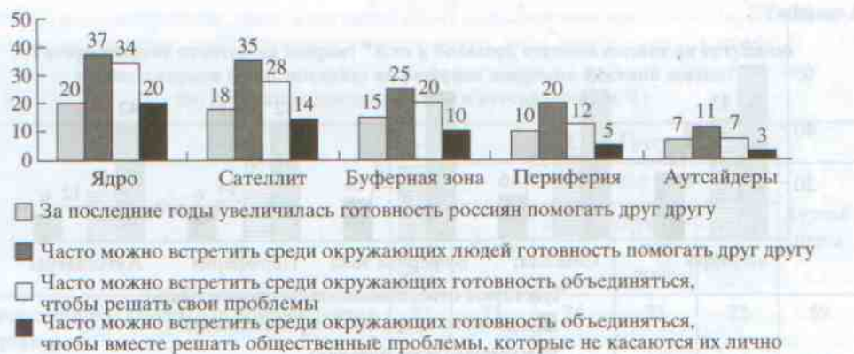
Рис. 3. Доли респондентов по группам социальной базы и аутсайдерам (в %).

ственной жизни, общественной работе, одинаковое вероисповедание, сходство по политическим ориентациям. Наряду с представителями ядра члены его сателлита чаще других упоминают о таких общих признаках, как (в порядке убывания): сходство по характеру, привычкам, одинаковые хобби, увлечения, сходство по образованию, по профессии. В одинаковой мере важно для представителей всех групп соседство по дому, близость по возрасту, полу, материальному положению, по семейному положению, пребывание в одинаковой жизненной ситуации, одинаковая национальность, отношения с земляками и проживающими в одном городе (селе, поселке), и шире – с гражданами одной страны. Таким образом, у представителей ядра не только более развита идентичность, но она имеет ярко выраженный крен в сторону субъектности в общественно активном смысле.