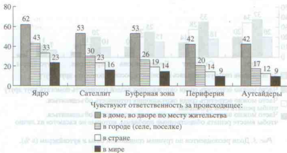
Рис. 4. Доли респондентов по группам социальной базы и аутсайдерам (в %).

боте, выше среднероссийского показателя в ядре социальной базы и его сателлите (70% и 67%, соответственно, против 57%). В аутсайдерах таковых лишь 39%, что объясняется не столько особенностями гражданского самосознания представителей этой группы, сколько спецификой ее состава по социально-демографическим характеристикам. Так, 45% членов этой группы – в возрасте 55 лет и старше.