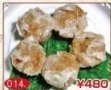
014. ¥480 五目焼売 (5個)