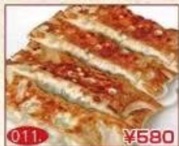
011. ¥580 手作り 鉄板餃子(4本)