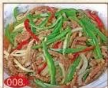
チンジャオ ロース丼