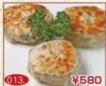
013. ¥580 エビニラ焼き 饅頭(3個)