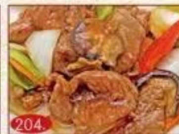
204. 牛肉のオイスター ソース炒め