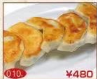
010. ¥480 手作り 焼き餃子(5個)