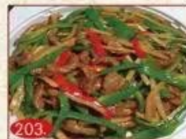
203. ビーマンと牛肉の 細切り炒め