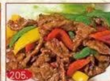
205. 牛肉の四川風炒め