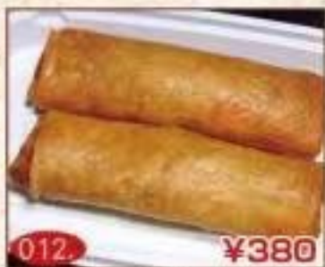
012. ¥380 春巻 (2個)