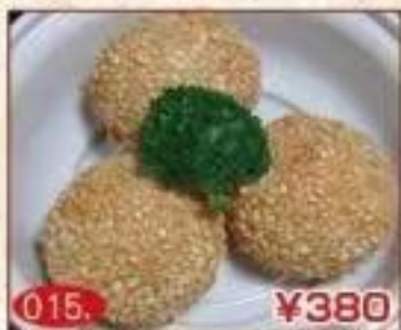
015. ¥380 ごま団子 (3個)