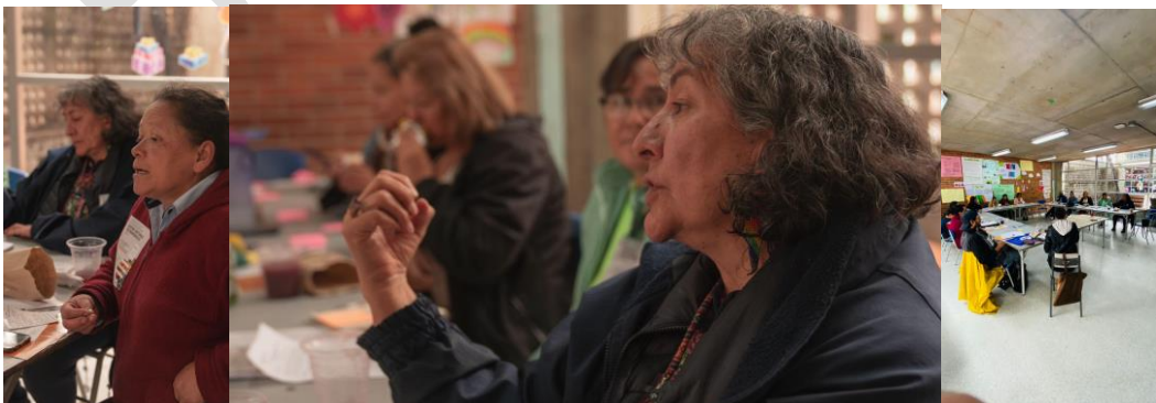
Fotos 5,6, y 7. Tercer encuentro de experiencias entre entornos patrimoniales, Mesa 2, IDPC, 2023.

A continuación, se presentan los principales aportes y hallazgos que surgieron en la mesa de trabajo en cada una de las rondas de intervención que se realizaron.