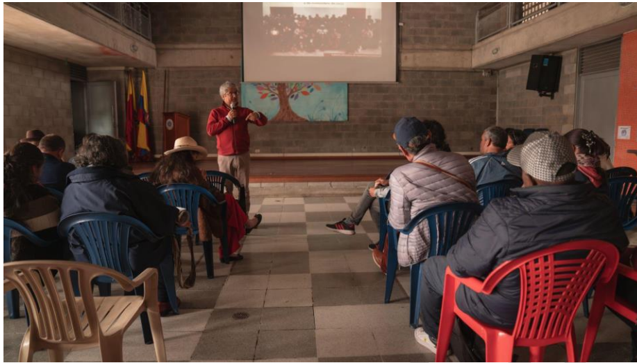
Foto 12. Tercer encuentro de experiencias entre entornos patrimoniales, plenaria, IDPC, 2023.

Finalizadas las intervenciones de las mesas, se abre el momento para las intervenciones de las instituciones o sus representantes, para que, a partir de los instrumentos y herramientas disponibles actualmente, se logre el reto de que estos planteamientos trasciendan el ejercicio de empalme con la nueva admiración.