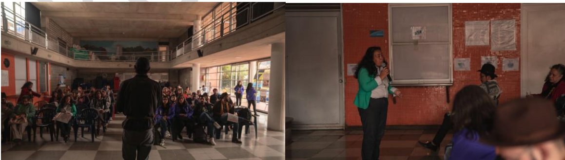
Fotos 8 y 9. Tercer encuentro de experiencias entre entornos patrimoniales, plenaria, IDPC, 2023.

La propuesta del encuentro contempló el desarrollo de un momento de plenaria donde se compartieron las principales ideas de las mesas temáticas y se buscó la identificación de ideas, propuestas y sugerencias asociadas a las posibles rutas de trabajo colaborativo para la sostenibilidad de los entornos patrimoniales de la ciudad. A continuación, se presentan las conclusiones de cada mesa presentadas por las personas designadas como voceras y las ideas propuestas desde varios actores presentes: