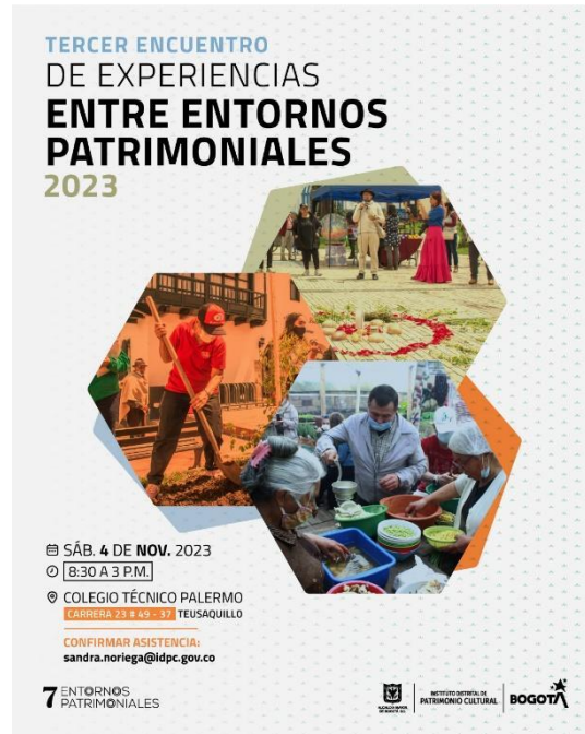
Imagen 1. Pieza gráfica Tercer encuentro de experiencias entre entornos patrimoniales, IDPC, 2023.

Este encuentro de experiencias buscó el reconocimiento de las acciones y estrategias planteadas de forma autónoma por los diferentes actores locales (ya sean organizaciones, colectivos, artistas, gestores culturales), a partir de sus lecturas diversas de los entornos patrimoniales priorizados para la activación de los patrimonios por el IDPC. Un reconocimiento en clave de aprendizaje para la identificación de estrategias orientadas a la sostenibilidad de los entornos patrimoniales y del fortalecimiento de los procesos locales.