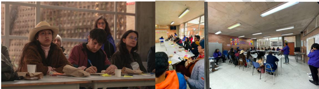
Fotos 2, 3 y 4. Tercer encuentro de experiencias entre entornos patrimoniales, Mesa 1-3, IDPC, 2023.

A continuación, se presentan los principales aportes y hallazgos que surgieron en la mesa de trabajo en cada una de las rondas de intervención que se realizaron.