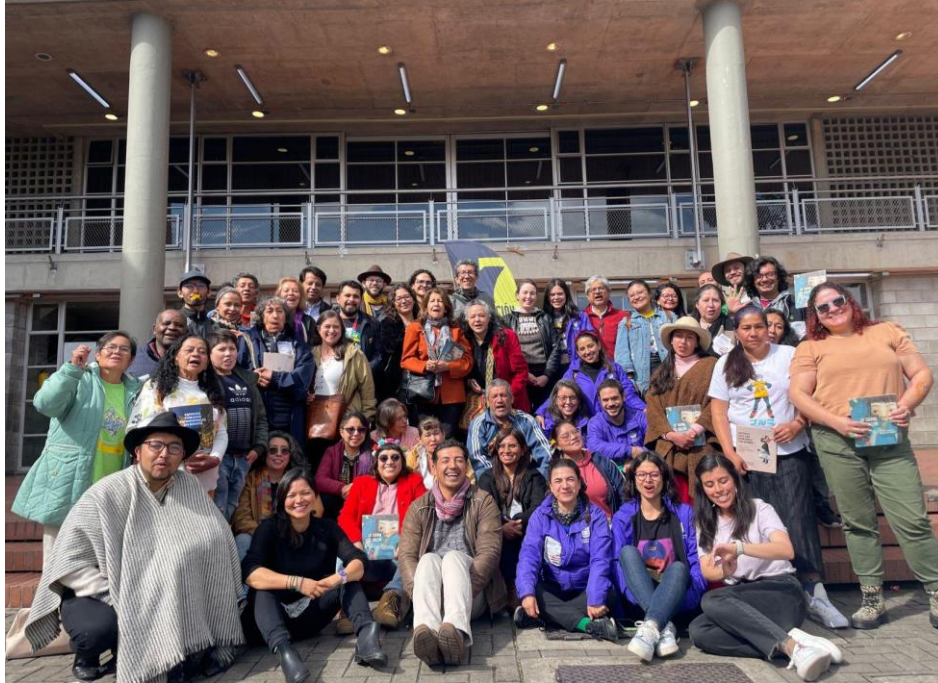
Foto 1. Tercer encuentro de experiencias entre entornos patrimoniales. IDPC, 2023.

La activación de 7 entornos patrimoniales es una de las meta de la Subdirección de Gestión Territorial del Patrimonio (SGPT) del Instituto Distrital de Patrimonio Cultural (IDPC) a través de la cual se propone “...consolidar los entornos patrimoniales de Bogotá como referente de significados sociales y determinante del ordenamiento territorial sostenible, mediante estrategias orientadas a la comprensión y fortalecimiento de sus dinámicas sociales, culturales, económicas, urbanas y ambientales” (IDPC, 2020, p. 9).