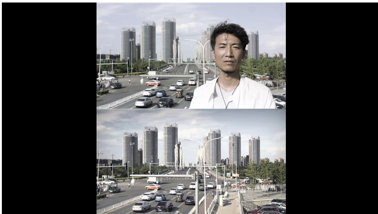
Figura 2 | Fermo immagine del video: Af a Tongzhou.

fa sport in un parco lungo un fiume, un altro noleggia una bici ad un bike-sharing, altri ancora aspettano un conoscente di fronte all'uscita di una stazione della metropolitana. Riconosciamo aspirazioni: la casa, i vestiti, il matrimonio. Riconosciamo i più semplici elementi della vita di tutti i giorni: anche qui il benessere si misura in autovetture, condizionatori, lavatrici e cellulari. Più si avanza nell'itinerario più la pretesa di eccezionalità di questi spazi vacilla, al punto che, come ci invitano a fare i video conclusivi, siamo portati a rispecchiarci nella quotidianità di Peter a Lanzhou o Af a Tongzhou [fig. 2], e trasformarci da voyeur a protagonisti.