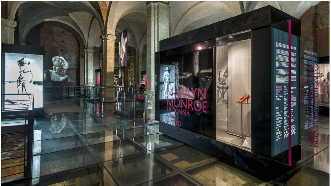
Palazzo Madama, Torino, mostra Marilyn Monroe La donna oltre il mito. Le teche che accolgono abiti e oggetti d'affezione al loro primo utilizzo. Verranno riutilizzate quattordici volte dalla Fondazione Torino Musei non solo a Palazzo Madama.

di capolavori tali e resi tali dalla critica (o dai social) regge la debole e instabile attenzione dei visitatori. La mostra di Antoine de Lonhy a Palazzo Madama si apriva con un cavallo in resina perfettamente bardato che evocava il viaggio dell'artista: è stato l'oggetto più fotografato, fondale di infiniti selfie.