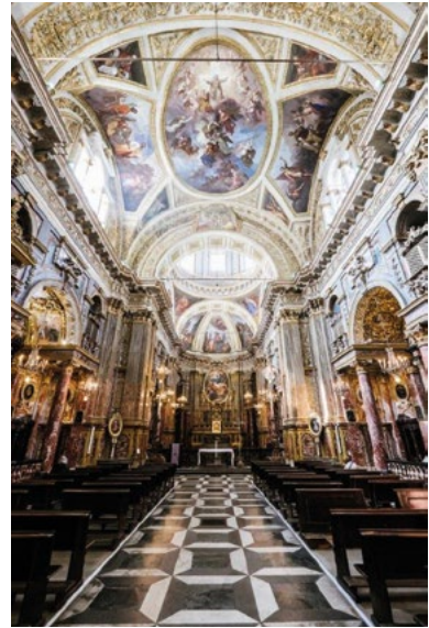
1-2: Chiesa dei Santi Martiri.

I due casi presentati durante l'itinerario – la chiesa dei Santi Martiri e l'ex complesso conventuale di Santa Chiara, con chiesa e coro – testimoniano la messa in atto di differenti strategie di valorizzazione e riuso del patrimonio architettonico religioso, altrimenti destinato a fenomeni di dismissione. Il nuovo uso sociale di questi due beni, supportato da accurati e documentati interventi di restauro, mette in luce un'intuizione lungimirante degli enti gestori e proprietari delle chiese che ha come obiettivo un nuovo ruolo attivo degli edifici di culto e delle sue dirette pertinenze nel contesto urbano. La capacità resiliente e adattiva dell'architettura si pone quindi come un tramite per lo sviluppo e il consolidamento di nuove relazioni tra le comunità e il contesto urbano.