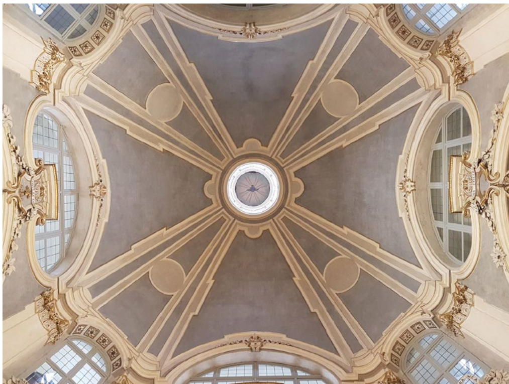
5: Chiesa di Santa Chiara, la volta dell'aula liturgica dopo il restauro.

(2019) e dei fronti esterni del complesso (2020). Quanto resta dell'ex convento è stato rifunzionalizzato per il cohousing dei giovani abitanti che, ospitati temporaneamente nella struttura, svolgono attività di manutenzione della stessa, e visite e iniziative volte alla valorizzazione del pregevole complesso barocco. Il coro, non più officiato, ha un uso polifunzionale aperto alle esigenze della comunità locale oltre a ospitare attività rieducative gestite direttamente dagli educatori del Gruppo Abele.