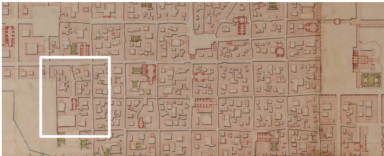
2. Copia della carta dell'interno della città di Torino, che comprende ancora il Borgo di Po, 1762 (Archivio di Stato di Torino, Corte, Carte topografiche per A e B, Torino 16), stralcio. Nel riquadro l'isola di Santa Monaca con la chiesa, e le due isole (San Grisante a sinistra e San Martino a destra) attraversate dalla Via della Misericordia.

come l'isolato in questione si fosse mantenuto compatto per molto tempo, in linea dimensionale omogenea con il susseguirsi degli isolati adiacenti, sebbene presentasse già nel Seicento una piccola strada di accesso. La processione pasquale e le frequenti cerimonie di accompagnamento al patibolo dei condannati a morte – il cui percorso prevedeva una prima sosta alla chiesa dei Santi Martiri per ricevere la 'benedizione dell'agonia' e poi una sosta a Santa Croce (ora Basilica Mauriziana), per poi concludersi al patibolo in piazza delle Erbe 14 – sono le ragioni funzionali che legittimano un vero e proprio sventramento dell'isolato.