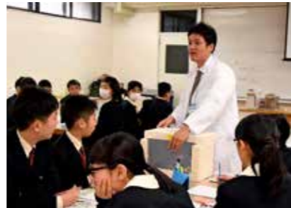
積水ハウスの社員と断熱材の実験をする生徒（京都市南区で）

学校を訪問したのは、野村ホールディングス、三菱東京UFJ銀行、積水ハウス、関西電力、東レ、日本航空、読売新聞の計7社の社員。同中の1年生243人に日頃の業務を紹介したり、実験を通じて研究内容を説明したりした。金融教育やエネルギー問題、中空糸膜を使った水質浄化、外国人観光客へのホスピタリティなど、社会の現状を踏まえた盛りだくさんのテーマが準備されていた。