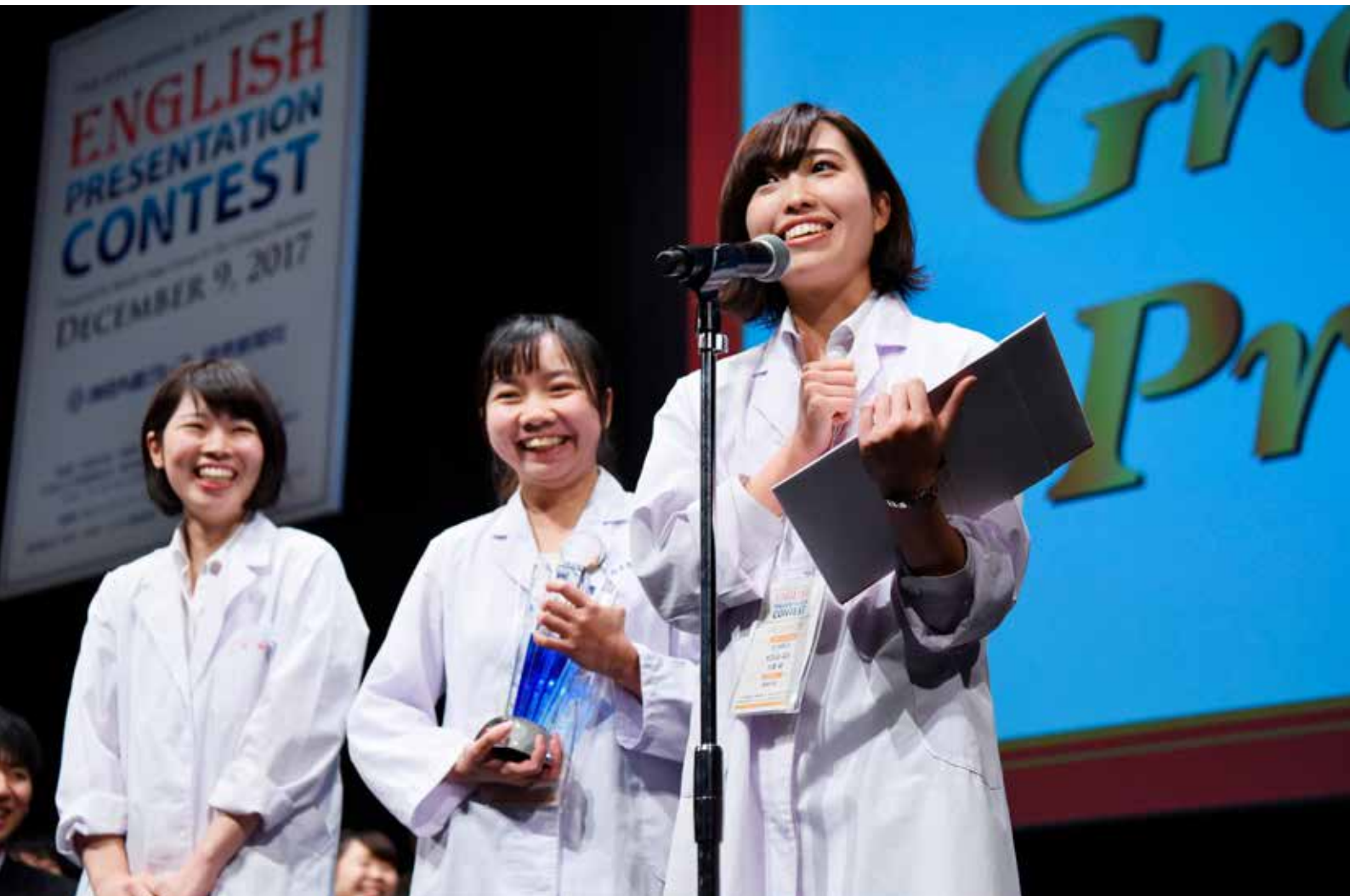
第6回全国学生英語プレゼンテーションコンテストで最優秀賞を受賞した崇城大学の3人(記事2・3面へ)