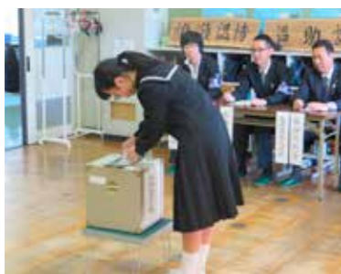
くじで性別や年代、社会的立場を決め、その立場から全員が投票した