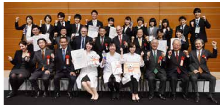
コンテストを終え、決勝の舞台上に立った出場者全員と主催者代表、審査員が記念撮影

現代的な課題をわかりやすく解説する発表ばかりだった。準備してきたことを自信をもって発表するの大事だが、予想外の質問をされた時にも答えられるよう、関連事項まで深く考えを巡らせておくことが課題だろう。