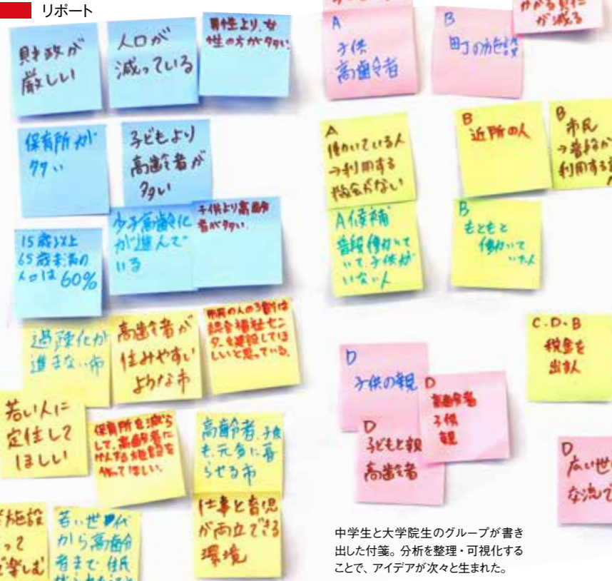
中学生と大学院生のグループが書き出した付箋。分析を整理・可視化することで、アイデアが次々と生まれた。