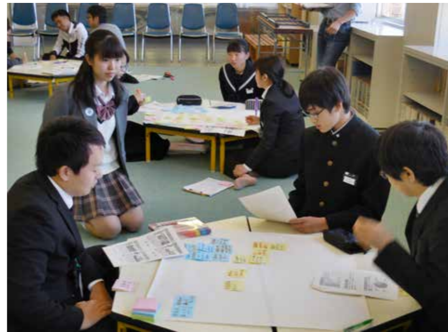
初めて使う付箋に戸惑った生徒らも、慣れると次々と政策への考えを書き出していた