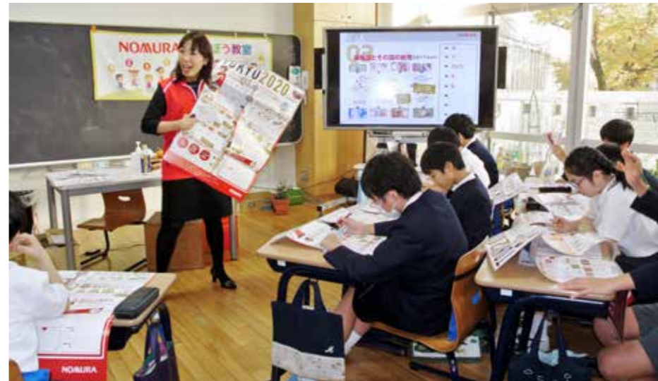
東京2020オリンピック・パラリンピック競技大会に向けた同社の教材を使って授業を受ける児童ら

野村ホールディングスの「NOMURAまなぼう教室」の出前授業が11月29日、東京渋谷区の青山学院初等部で行われた。授業を受けたのは、初等部5、6年生の総合活動「販売プロジェクト」に参加している13人。初等部では社会活動について学ぶための14のプロジェクトがあり、販売プロジェクトは、校内でノートを販売することで経済のしくみなどを学んでいる。