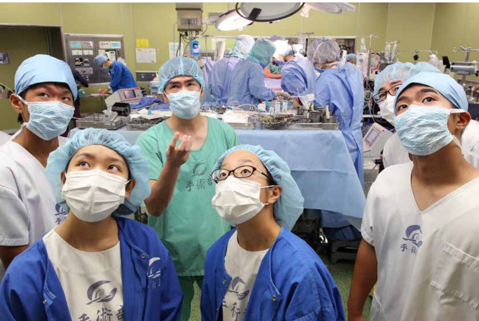
手術室のモニターを見ながら、人工血管をつなぎ合わせる様子を生徒らに説明する医師（左から3人目）。医師を志す高校生29人が大阪大と順天堂大の医療チームに密着した（2～5面へ）