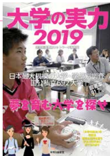
「大学の實力2019」 A4判 192ページ / 1650円(税別) 問い合わせ：中央公論新社 (TEL.03・5299・1730)

偏差値ではなく「教育力」で大学選びをするための情報提供を目的にしている「大学の實力2019」が出版された。大学・学部ごとの退学率や卒業率、就職率などをこれまで通り一覧表形式で掲載したほか、「多様性(ダイバーシティ)」への取り組み紹介にページを割いた。