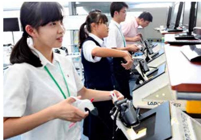
シミュレーションセンターでは模擬手術も体験した