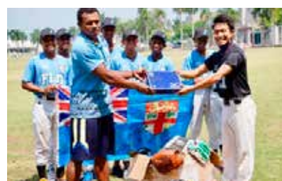
フィジー野球協会に用具を寄贈するJICAのボランティア

プロジェクトの概要及び寄付の方法は、公式サイトをご覧ください。 https://www.yomiuri.co.jp/adv/glove/