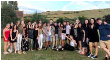
(上)三菱商事ロンドンオフィスを訪問