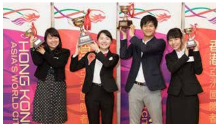
昨年度の学生大使

香港特別行政区政府 駐東京経済貿易代表部と読売新聞社が発行する日刊英字紙 The Japan News は、香港と日本のかけ橋となる「学生大使」を募集しています。