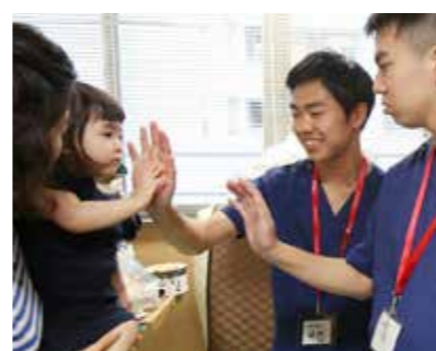
生徒たちは補助人工心臓をつけた女の子を訪れて「がんばってね」と声をかけた