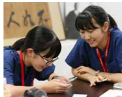
連絡先を交換しよう—— 濃密な実習を過ごす生徒たちは、学校を超えてすぐに仲よくなる