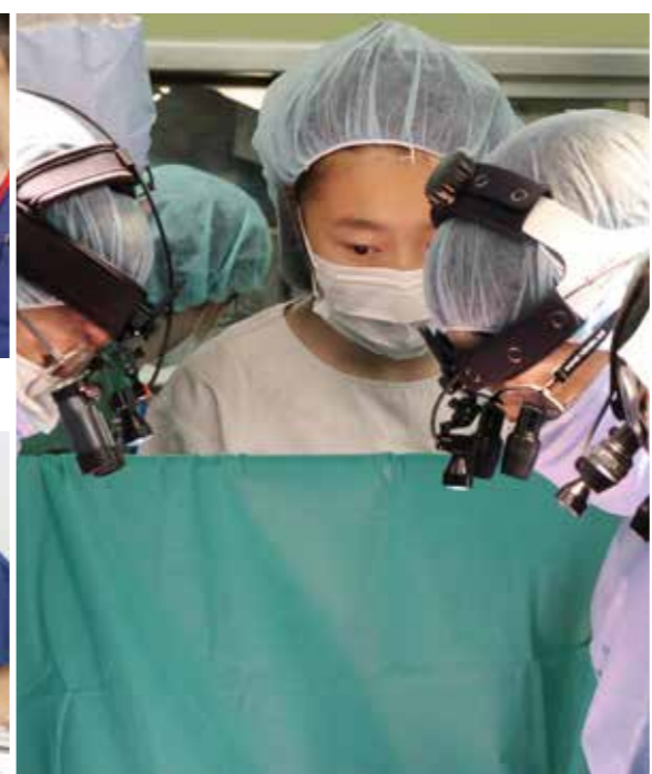
心臓手術を間近で見守り、「困難な手術であってもあきらめない外科医になる」と心に誓った

るのですか」と母親に尋ねた。「補助人工心臓が外れる時が移植だよ」とドナーのことを理解するのは、まだ難しい年齢だから」と、穏やかな口調で答えた。塩分や水分の制限を守らせるより、「これは飲んだり食べた