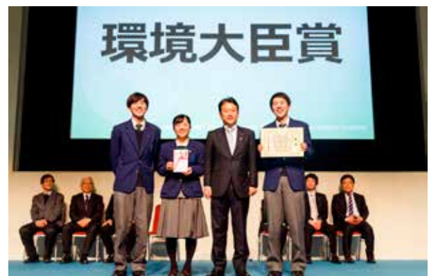
今年2月に行われた第3回全国大会の様子(上から)ワークショップ、発表、表彰式

【公式サイト】 https://www.erca.go.jp/jfge/youth/index.html