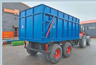
Полуприцеп тракторный самосвальный ПТС-12