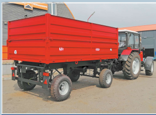
Прицеп тракторный самосвальный 2ПТС-6,5