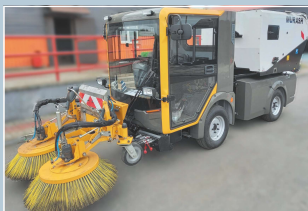
Машина коммунальная малогабаритная ММК 2000