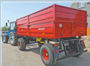
Прицеп тракторный самосвальный 2ПТС-10