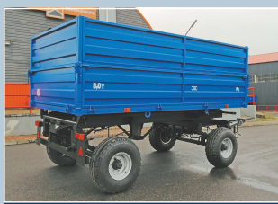
Прицеп тракторный самосвальный 2ПТС-8