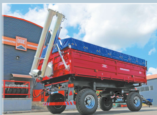
Прицеп тракторный самосвальный 2ПТС-6,5 ЗЕРНОВОЗ