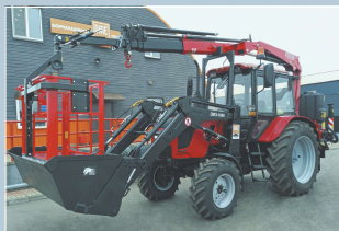
Подъемник монтажный универсальный ПМУ-15