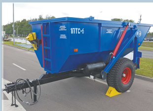
Полуприцеп тракторный самосвальный 1ПТС-6