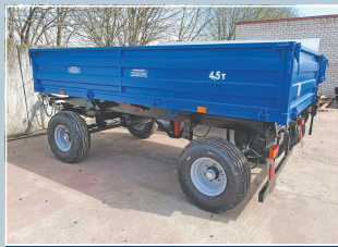
Прицеп тракторный самосвальный 2ПТС-4,5