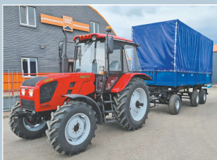
Прицеп тракторный самосвальный 3ПТС-9