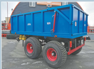
Полуприцеп тракторный самосвальный ПТС-9 с гидробортом