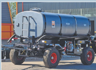
Машина поливомоечная МП-6