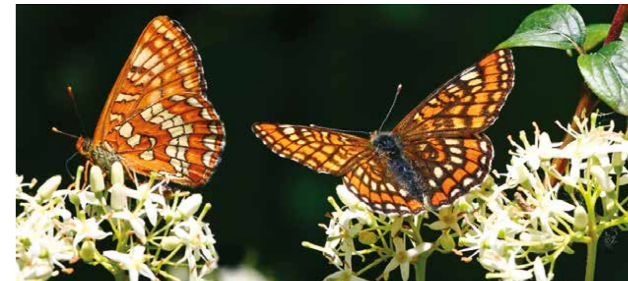
Eschen-Scheckenfalter ( Euphydryas maturna ) sind auf Eschen-Jungwäldern angewiesen und damit eine der seltensten Tagfalterarten Deutschlands, Elster-Luppte-Aue, Mai 2013

Zielvorstellungen zum erforderlichen oder angemessenen Flächenumfang von Schutzgebieten ohne Bewirtschaftung lassen sich nicht allgemein wissenschaftlich begründen. Wie bereits dargelegt wurde, wird in Sachsen-Anhalt mit den Waldflächen, die bereits aus der Bewirtschaftung genommen worden sind, beziehungsweise bei denen dies fest in entsprechenden Planungen verankert ist, sowie mit den im Rahmen des Nationalen Naturerbes zu erwartenden Flächenstilllegungen durch Stiftungen und Verbände ein angemessener Anteil unbewirtschafteter Wälder erreichbar sein. Eine weitere Erhöhung würde zu Lasten der anderen dringlichen Anforderungen an die Waldbewirtschaftung gehen und bedarf daher besonders sorgfältiger Einzelfallprüfung.