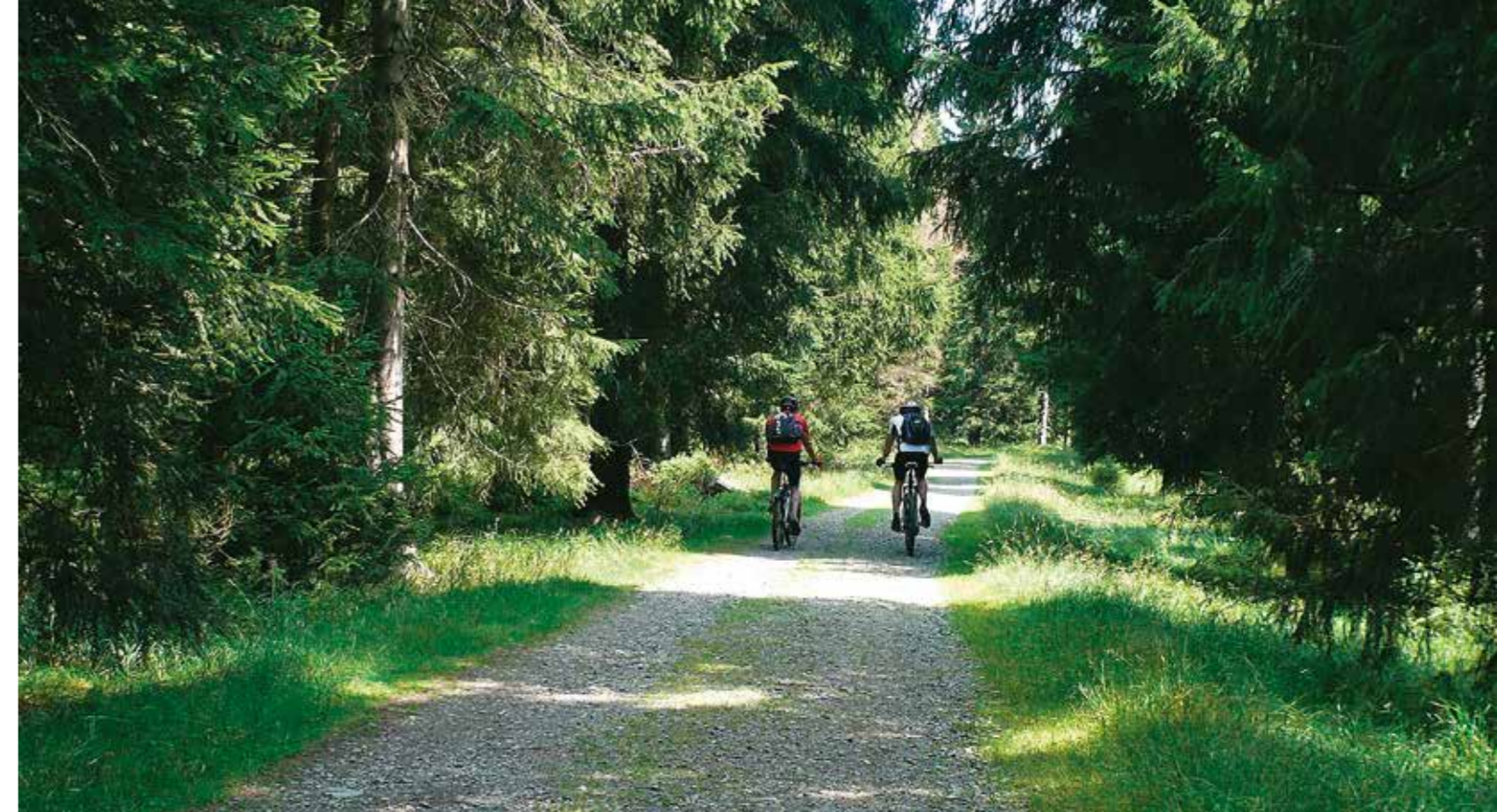
Mountainbiker im Oberharz Foto: Lutz Döring

Wandergruppe auf ausgewiesenem Wanderweg im Harz Foto: Lutz Döring