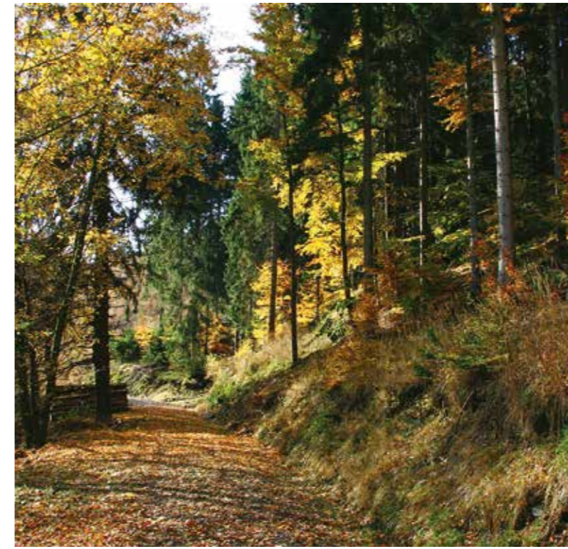
Waldweg im Mischwald