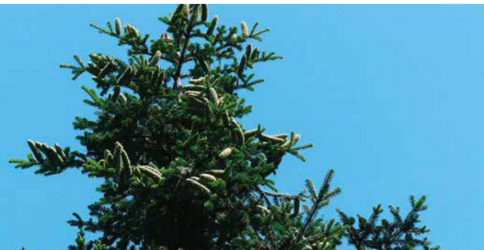
Douglasie mit Zapfen

Bodenbearbeitung soll nur erfolgen, wo dies die Konkurrenzflora oder die Humusaufgabe erfordern. Erforderliche Bodenbearbeitung erfolgt nur streifen- oder plätzeweise ohne tiefen Eingriff in den Mineralboden.