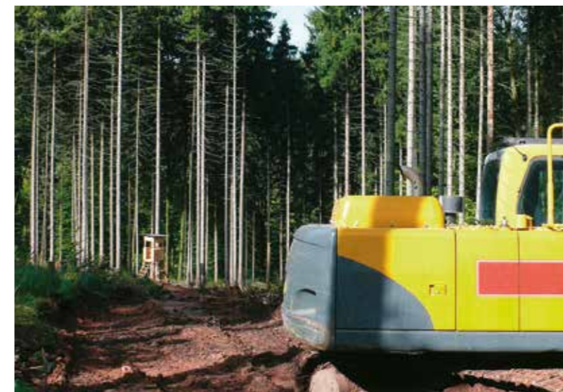
Wegebau im Südharz