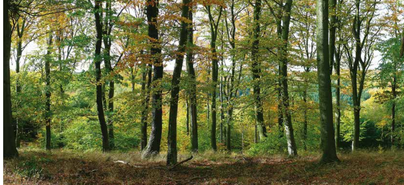
Buchen-Mischwald im Unterharz