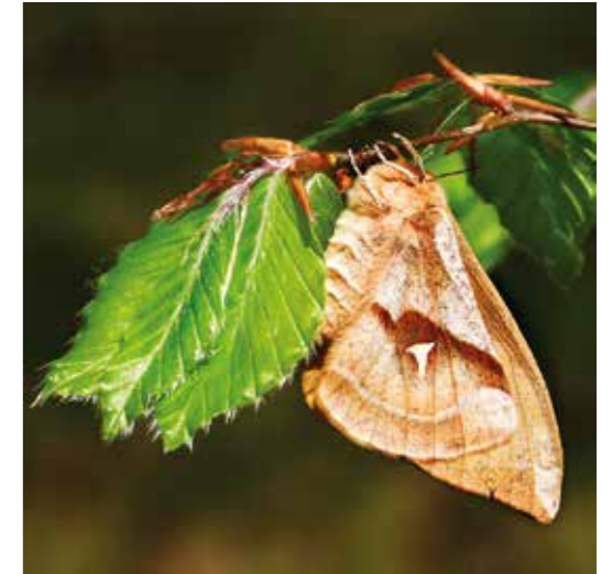
Frühlingsbote im Buchenwald - ein weiblicher Nagelfleck (Aglia tau) im Ziegelrodaer Forst, April 2014