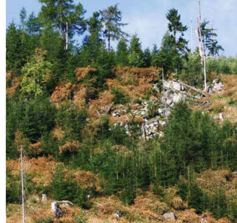
Naturverjüngung in Hanglagen des Harzes

rung der Biodiversität (z.B. jahreszeitliche Steuerung der Restholzentnahme) eine größere Bedeutung.