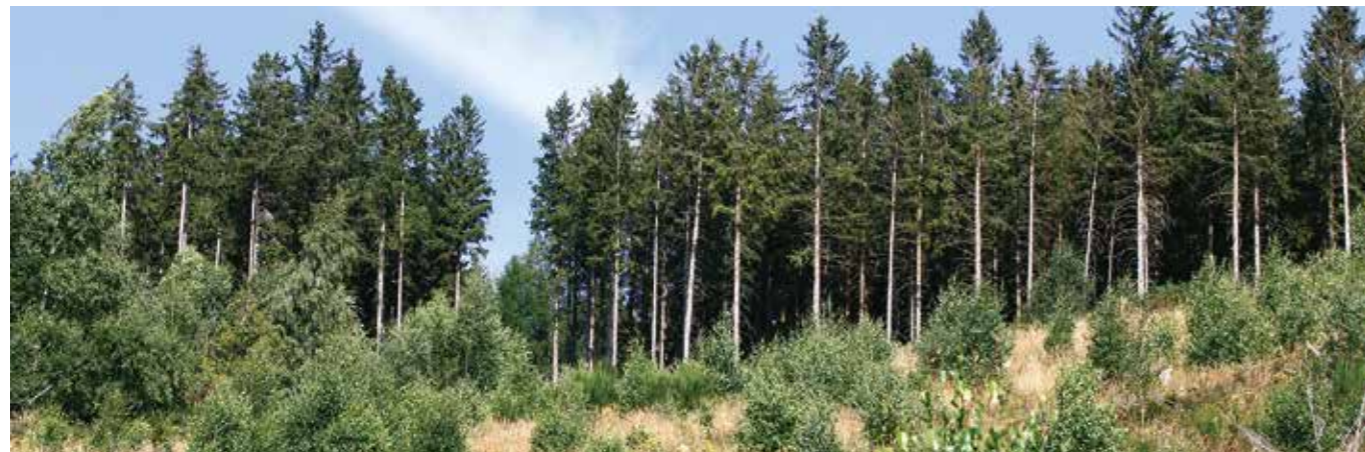
Sturmgeschädigter Hangwald im Harz

In diesem Sinne gelten folgende Empfehlungen: