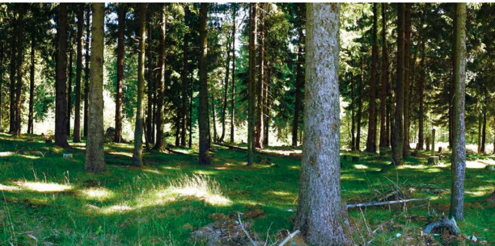
Alter Nadelwaldbestand

Nachhaltigkeit im Wald erfordert auch nachhaltige personelle Entwicklung. Dies ist bei der weiteren Entwicklung der personellen Ausstattung und der qualifizierten Ausbildung zu berücksichtigen. In diesem Sinne sollen die Anstrengungen zur erneuten Einführung der kontinuierlichen Ausbildung forstlichen Fachpersonals durch das Land forciert werden.