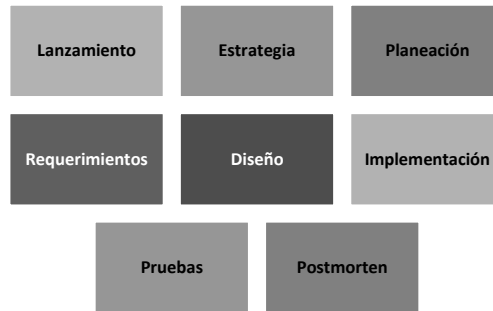
Fig. 3 Fases de TSP, descritas en [12], [elaboración propia].

Como toda metodología que busca la continua mejora de procesos, TSP posee fases en donde se describen una serie de pautas para ayudar a realizar un buen desarrollo de software por parte del equipo de trabajo. Las fases descritas por [12] son mostradas en la Fig. 3.