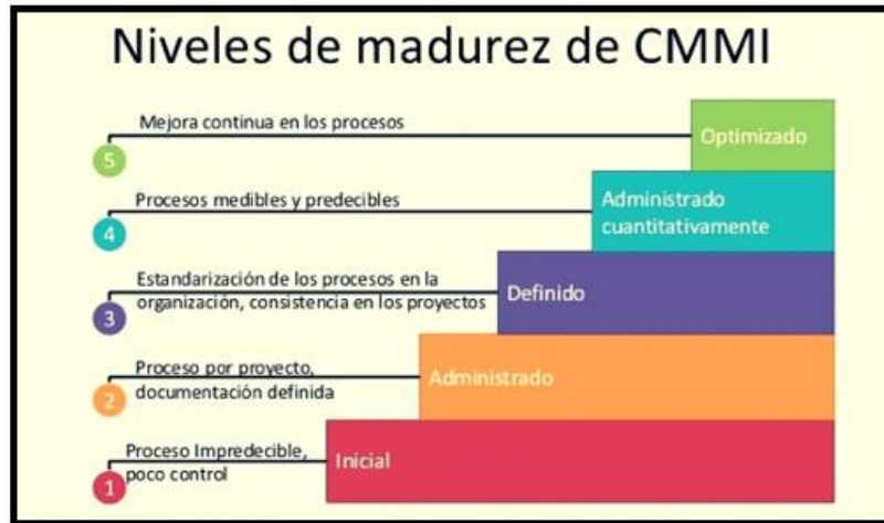
Fig. 2 Ilustración de los Niveles de Madurez CMMI.

Análisis (MA), Gestión de la Configuración (CM), Aseguramiento de Calidad de Proceso y Producto (PPQA). CMMI es utilizado en más de 5000 empresas de las cuales 24 son empresas ubicadas en el Perú. En su gran mayoría las empresas peruanas se encuentran en nivel 2 y 3 [8].