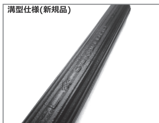
写真1 (新規技術) 溝型低風圧電線の外観

外観は写真1に示す通り、絶縁被覆の長手方向に溝を形成している。後述するような表面に微小な球状凹凸をつける構造等、様々な候補を検討したが、低風圧特性・電気特性・加工容易性の観点から、溝型形状を選定し、溝の数、深さ、幅などを最適化した。また、当社製電線は、主に線路保守上の要請のため、表面に電圧・品名・製造社名・製造年などを浮き彫り表示しているが、その視認性にも配慮して、構造選定を行った。