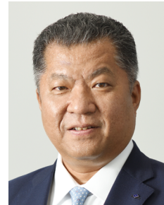
常務取締役 電線・エネルギー事業本部長