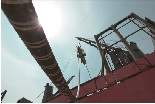
写真1 海底ケーブル布設工事 (NEMO プロジェクト)