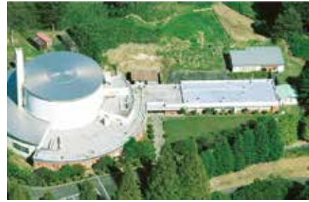
原子力研究所【王禅寺キャンパス】

るための研究を行っています。具体的には熱流体工学 ※3 という学問をベースに、プラント内部を循環する「流れ」の中から、安全性向上の観点から重要なものを取り上げ、基礎実験とコンピュータシミュレーションを駆使してその「流れ」を詳細に分析し、制御する方法を研究しています。実は私が博士号を取ったのは原子力とは一見関係のない化学工学という分野で、生体内における血液の循環システムに関する研究でした。現在は、それを原子力プラント内の循環システムの研究に活かしているわけです。