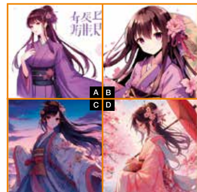
※正解は紙面最下部に記載しています。

次の4枚のイラストは、生成AIが紫式部、清少納言、小野小町、小野妹子をそれぞれイメージし、アニメ風イラストとして作成したものです。このうち「清少納言」はどのイラストでしょうか?