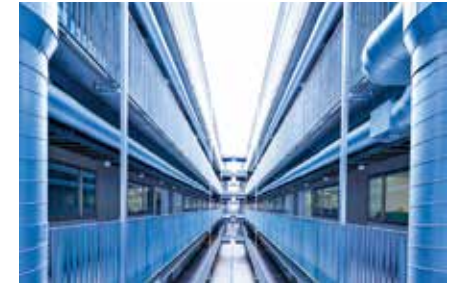
理工学部の研究室が入る新研究棟【世田谷キャンパス】