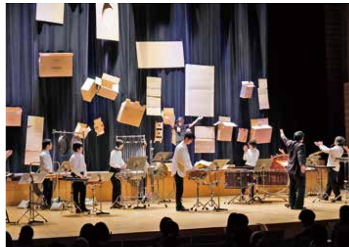
2022年度入学式:式そのものがアートになった

が生まれてきている。鑑賞の仕方、創作や表現の仕方、変わった。作家の中には、VRゴーグルを使って鑑賞できる「バーチャルアトリエ」で制作する者も出てきている。そこでは重力のある空間では作れなかったものもできてしまうし、サイズも関係なくなる。これからの3年から5年ぐらいでは、こうした作品は急激に増え、これまでのリアル、物質文明で生み出された作品と同じぐらいの量になるのではないかと。その結果、現実の空間とバーチャルの空間がどんどん滲んできて、お互いに価値を交換できる時代になるかもしれない。