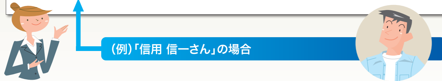
(例)「信用 信一さん」の場合