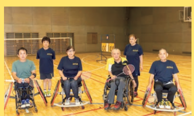
東京障がい者バドミントン連盟チーム。見事な車いすさばきからの高速ショットに注目!

体の近くに飛んできたシャトルを返すのは難しい! シャトルはどこに飛んできるとか分からないので、動きやすいように1回打つたびに元のポジションに戻しておくのがポイントです