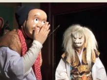
諏方神社での江戸里神楽の様子