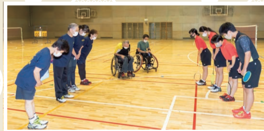
指導をしていただく東京障がい者バドミントン連盟の皆さんに挨拶。「よろしくお祈りします!」と元気な声が響きます

東京2020パラリンピックから正式競技となり、注目が集まっているパラバドミントン。車いすと立位の2つのカテゴリーがあり、障がいの種類や程度によって6つのクラスに分かれています。今回は、車いすを使ったバドミントンにチャレンジ。さあ、バドミントン部の実力を見せよう!