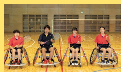
バドミントン部所属のジュニア記者チーム。顧問の先生も見守る中、いつもの実力が発揮できるのか?