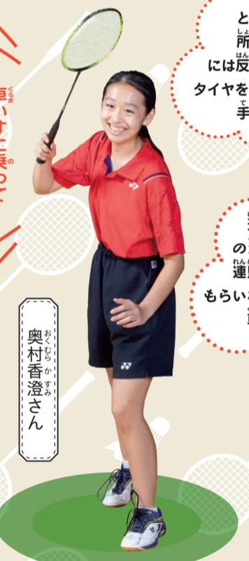
車いすに乗ってプレーするのは難しいね

ラケットを持った状態での移動に慣れるため、軽めのラリーにチャレンジ。さすがはバドミントン部、すぐにコツをつかみました