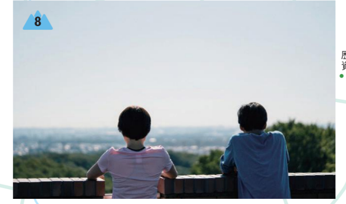
歴史民俗資料館分館