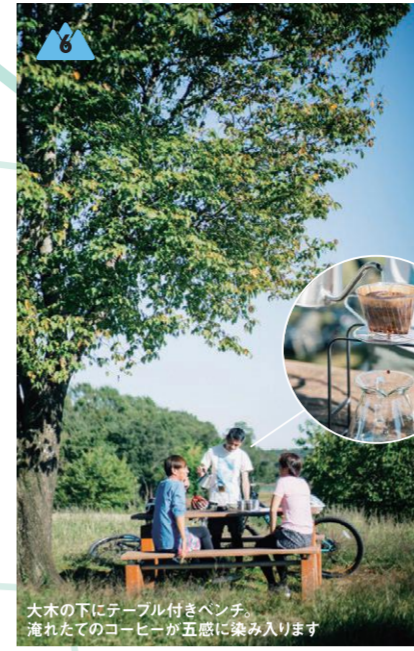
大木の下にテーブル付きベンチ。淹れたてのコーヒーが五感に染み入ります