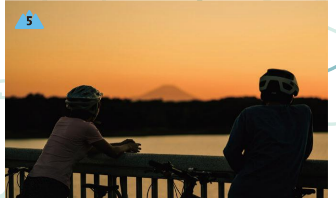
8月中旬から翌年、もぎ取り体験も楽しめます