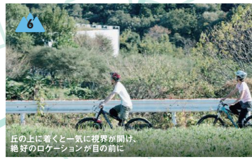
丘の上に着くと一気に視界が開け、絶好のロケーションが目の前に