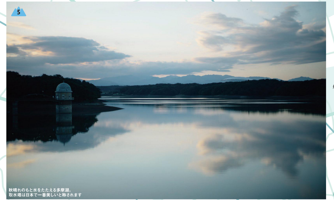
秋晴れのもと水をたたえる多摩湖。取水塔は日本で一番美しいと称されます