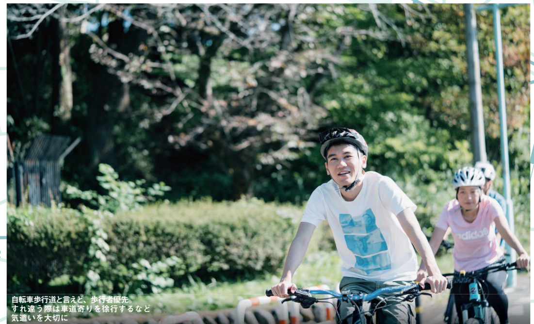
自転車歩行者などと、歩行者優先。すれ違う際は車道寄りを行くなど、気遣いを大切に