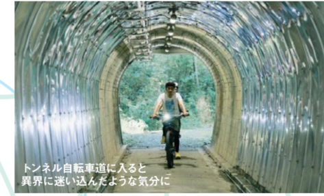
トンネル自転車道に入ると 真界に違い込んだような気分が