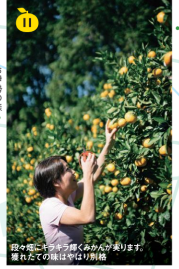
段々畑にキラキラ輝くみかんがなります。獲れたての味はやはり別格