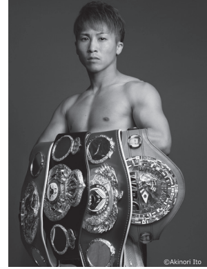
井上尚弥選手 (大橋ボクシングジム所属)

令和7年度のポスターモデルは、世界スーパーバンタム級4団体統一王者、史上2人目の2階級4団体統一を果たすなどの戦績を残し続けているプロボクサーの井上尚弥選手を予定しています。