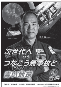
令和6年度危険物安全週間推進ポスター

〒105-0001 東京都港区虎ノ門二丁目9番16号 日本消防会館8階 (一財)全国危険物安全協会内 危険物安全週間推進協議会事務局 TEL 03-5962-8921