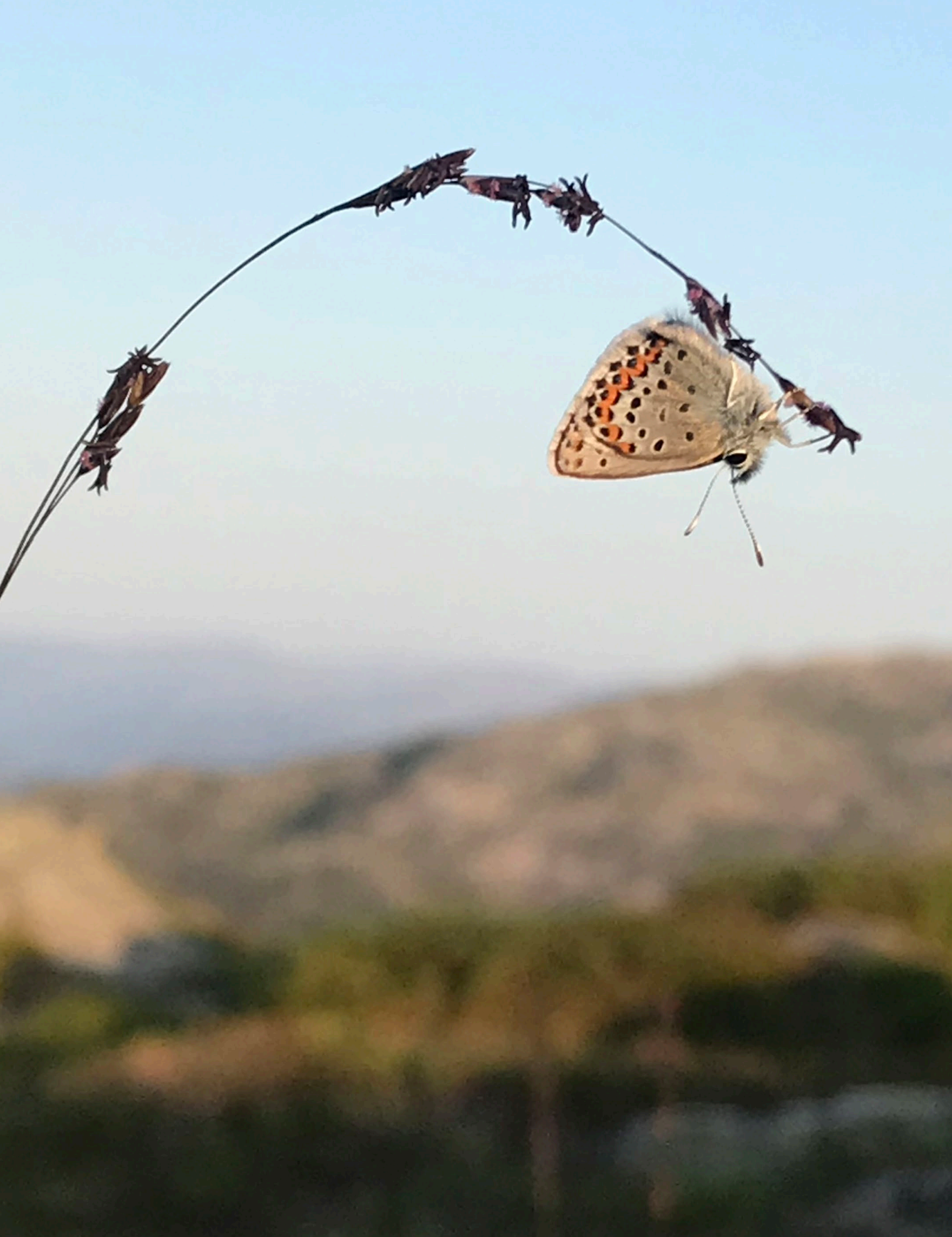
Blåvinger er dagaktive sommerfugler. For å skille de mange ulike artene av blåvinger fra hverandre, må man studere begge sider av vingene. Undersiden av dette eksemplarets vinger er fotografert i et fjellområde ved Romarheim i Alver kommune.