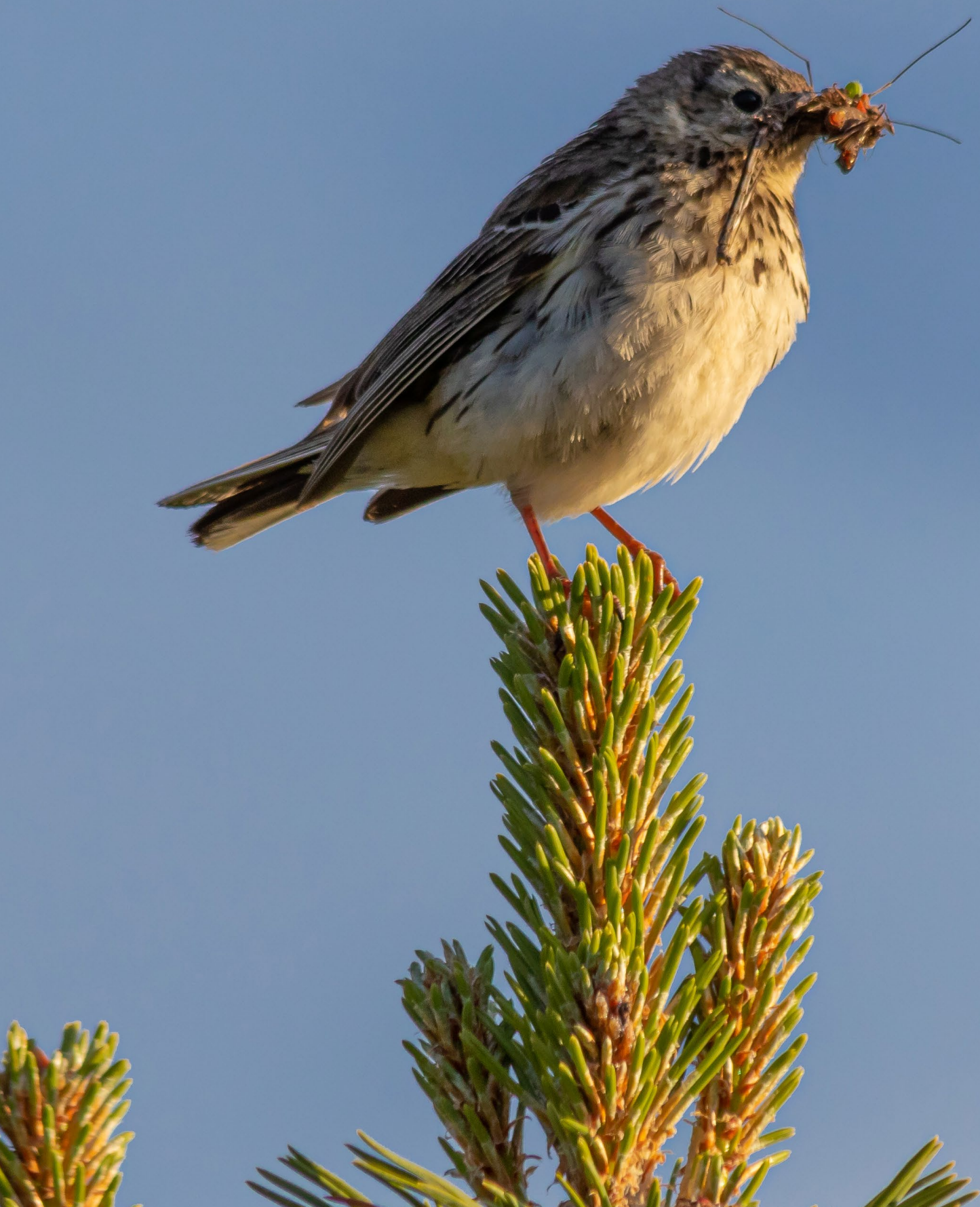
I likhet med insekter er fugler også viktige for mennesker, jordbruket og økosystemer. De sprer frø og regulerer insektbestander. Denne heipiplerka har gjort sin fangst ved Yddin i Valdres.